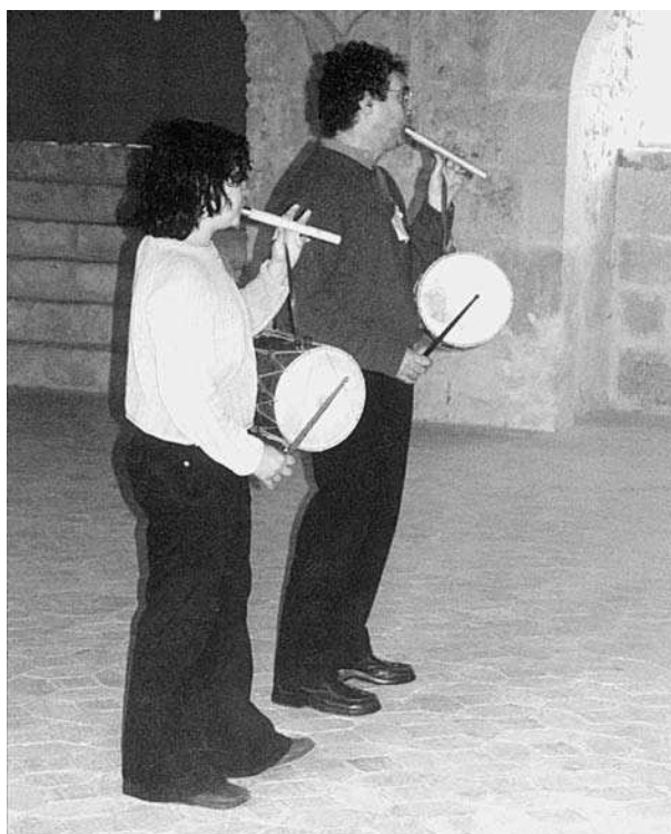
Músics tocant a la festa d'El Sac Ambulant al Monestir de Santes Creus (Alt Camp).

«El Sac Ambulant –com ja ens definíem en un tríptic de l'any 1978 i que citem textualment– és un conjunt de gent que té com a finalitat la investigació i difusió de danses populars de diferents països, especialment els mediterranis. Entenem la dansa com a mitjà d'expressió, d'esplai i de coneixement cultural». I aquest és un plantejament que hi és des dels inicis i es manté al llarg de tots aquests anys: la fidelitat i la qualitat a l'hora de transmetre una dansa. Per això, hem rebutjat sempre tot afany de lucre, de comercialització, de pura animació o d'espectacle. S'ha vol-