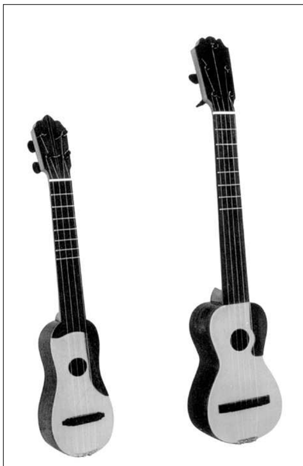
El tiple i guitarró menorquí.