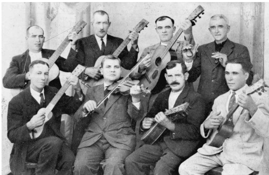
Grup de corda amb un parell de guitarrons.