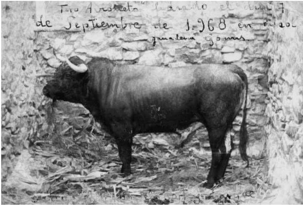
El bou Avioneto tancat al corro en Puçol el setembre de 1968 esperant ser embolat.

guanys econòmics del negoci taurí s'ha anat difonent la teoria que el futur de l'espècie taurina en estat salvatge depèn de la pervivència de les corrides de toros. 8 Per entendre la manca de fonament d'aquesta posició cal tenir en compte que, a hores d'ara, la immensa majoria dels festejos taurins no es podrien celebrar sense les subvencions de les arquitectures públiques estatals i europees que es canalitzen a través del Ministeri d'Agricultura. 9 Així doncs, un cop suprimides les celebracions de corrides i correbous, els diners públics amb què fins ara es pagava el manteniment de les places de toros i els serveis col·laterals (policia, Creu Roja, serveis veterinaris, hospitals provisionals, etc.), d'ara endavant es podrien sumar a les subvencions que actualment ja es destinen a la ramaderia extensiva tradicional de les deveses, tan característica, per exemple, del sud-oest de la península Ibèrica. D'aquesta manera, l'autèntica preocupació pel medi ambient i per la biodiversitat podrà garantir el manteniment d'un ecosistema únic al món i la pervivència d'una espècie singular que fins al segle XVII encara poblava els boscos europeus.