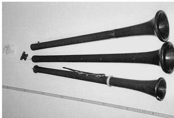
Tarotes del Museu d'Història de la ciutat de Girona.

Pel que fa al model més utilitzat, planteja una qüestió discutible quan a la tonalitat, doncs és un model homònim de la tenora com hem dit i, per tant, hauríem de dir que seria una tarota en Si b . Però també és homònima a l'octava inferior, del grall del sac de gemecs, d'ací el seu nom de tenor , i això ens dóna pistes per aclarir l'enigma de les particulars denominacions del tible i la tenora de la cobla de sardanes, en què el soprano primitiu seria el sac de gemecs.