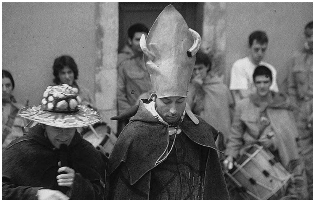
Representació del ball de diables de Vilafranca del Penedès (1998).