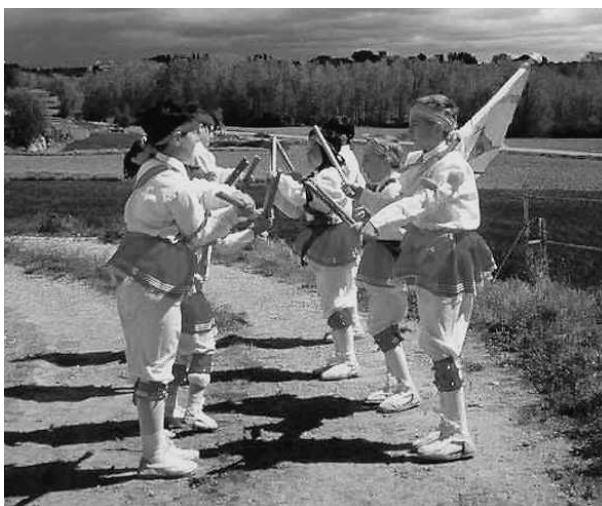
Balls de bastons a pagès. El dilluns de Pasqua, els petits bastoners de Prats de Lluçanès recorren les cases de pagès del municipi, ballant i recollint les menges que els donen.