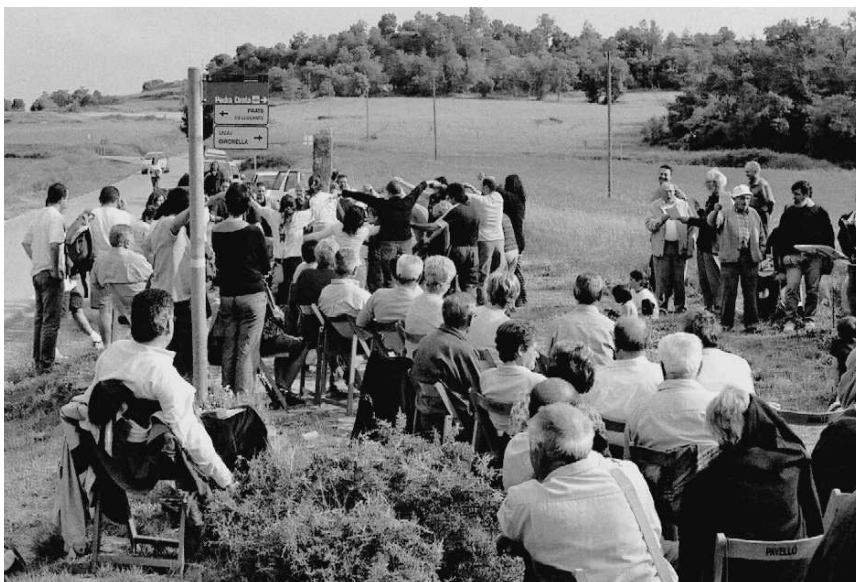
Pedra Dreta. El dilluns de Cinquagesma –segona Pasqua–, se celebra l'aplec al voltant de la Pedra Dreta, de Lluçà. Dansa i Tradició el dinamitza en el marc del cicle Solc. Cada any, més i més gent hi fa cap i berena, canta la cançó «El bon caçador» i balla al voltant de l'allargassada pedra.

La seva activitat al voltant de les danses ha permès la col·laboració estreta amb l'associació i el cicle Solc en diferents ocasions, com ara