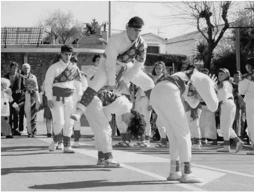
Ball dels Romeus. Dansa de Carnaval que, actualment, es balla per diferents indrets del poble de Prats de Lluçanès, coincidint en alguns moments amb la cercavila de disfresses i animació.

Canyes per Reis. Cada cop més balcons del poble es guarneixen amb canyes per anunciar que allà hi ha qui espera que ses Majestats els deixin els desitjats presents. Dansa i Tradició ha impulsat la recuperació d'aquest costum local, i per la Fira de Santa Llúcia regalen canyes a qui no les pot anar a collir.