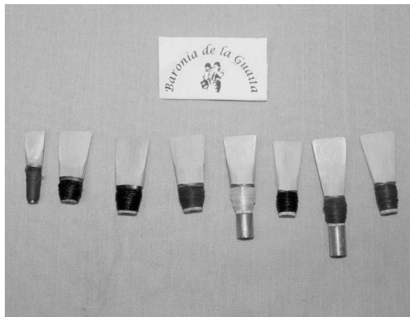
Diversos models de canya fabricats per Claramunt. D'esquerra a dreta: gaita gallega, dolçaina, grall (Vilanova), grall (Principa), dolçaina, tarota en Fa, tarota en Do i tarota en Do.