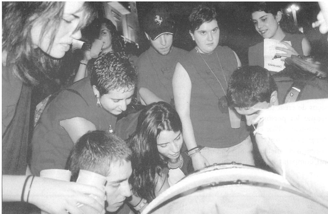
Adelebrades prop de la bóta.

‘Cantar’ i ‘beure’. Dos verbs amb una estreta i ancestral relació. I a casa nostra, com bé podem comprovar a través dels llibres, dels cançoners, de les cançons que ens canta la iaia, etcètera, aquesta ha estat una pràctica ben habitual. Coneguda junta i per separat. Per separat en les corals, cors de Clavé, escolanies –no sé si per a tots els components, la separació de pràctiques...–. I junt en les festes majors, en les tavernes i els bars, en els àpats col·lectius i familiars, vaja, quasi a tot arreu i quasi en tot moment.