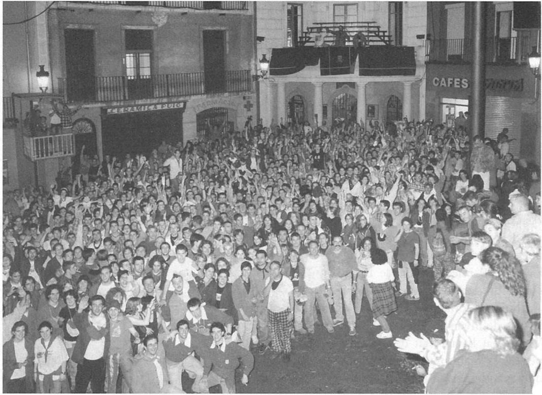
Vista general de l'ambient de la plaça abans d'iniciar-se l'anomenada «Patum dels borratxos» (26-6-2000).