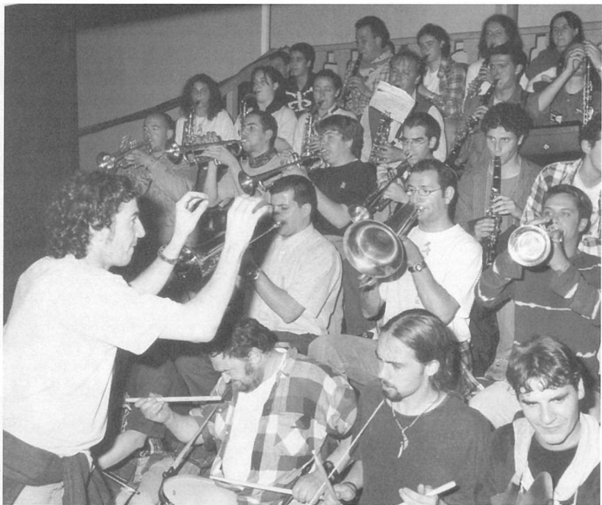
A mesura que avancen els anys cada cop hi ha més músics a l'empostissat de la plaça.