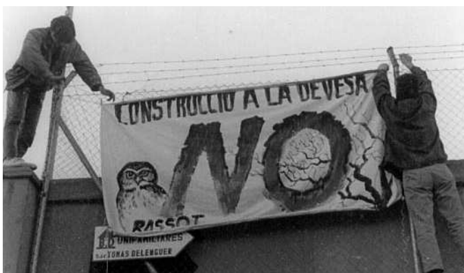
Protesta per la destrucció de l'Eixereta.

Aquesta idea de què tothom pot tocar, cantar i ballar, tal com feien els nostres avantpassats, sense necessitat de grans coneixements, és el que volem fer patent a les nostres festes a Ca Bassot. Aquestes festes se solen celebrar coincidint amb la realització d'un taller de ball i ser-