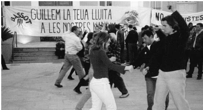
Activitats en la Setmana Antiracista i Antifeixista Guillem Agulló (2005).