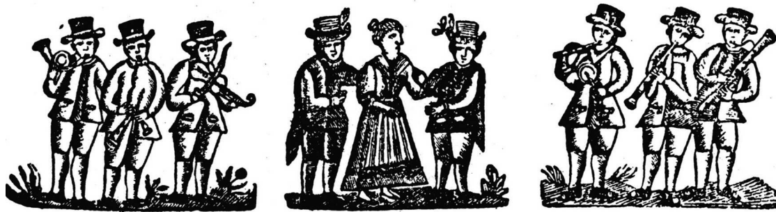
CONTRAPÀS LLARCH A LA USANSA EMPURDANESA.

La presència de trompistes en les bandes de ministrers i formacions de ball és més difícil de documentar, encara que ni ha partitures que avalen la seva presència. És prou determinant però el testimoni iconogràfic. A l'Arxiu Històric de la Ciutat de Barcelona, hi ha un plafó policrom, datat el 1769, que mostra una processó de Corpus on apareix una banda de ministrers composta per dues tarotes, un sac de gemecs, una trompa i un baixó. 1 És també emblemàtica l'agrupació o cobla rústega que mostra el gravat que encapçala diverses edicions vuitcentistes del contrapàs llarg. A banda i banda dels balladors hi apareixen els sonadors de trompa, sac de gemecs,