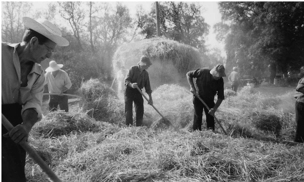
Segadors d'Avià rampillant la palla.