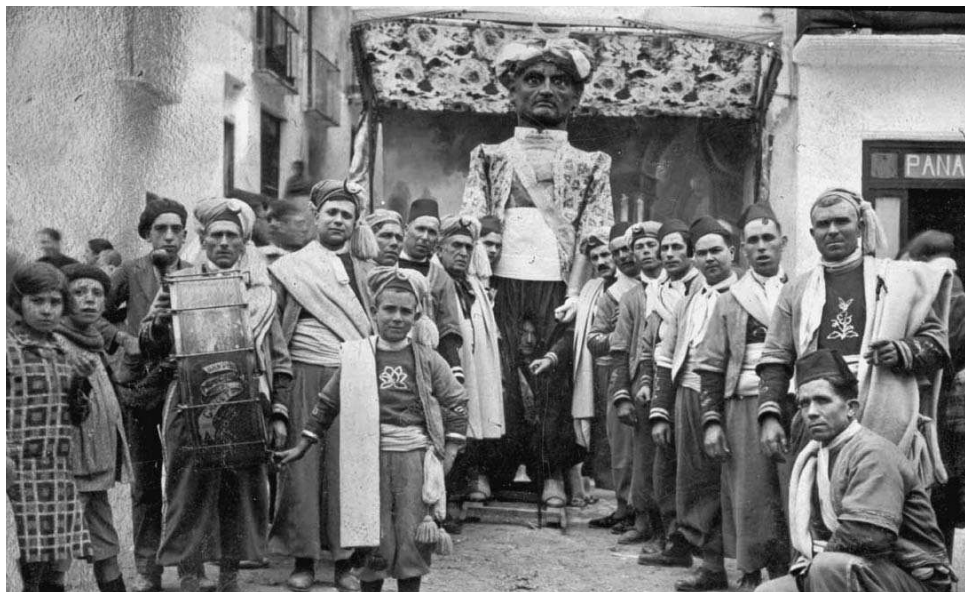
La Mahoma de Bocairent als anys vint del segle passat.

Ambaixador Cristià: «No me vengas con razones i sal del castell, gorrino. A mi casa ven Sultán, ven pronto, muy aprisita, pués todos se alegrarán quen nos hagas la visita. Yo tengo un serdo seabado, els dos juntets estareu, uno suelto, el otro atado, en pau els dos dormireu. Descansa que mi porquera está a tu disposición. Tè ofrezco en buena manera mucho estiercol pa colchón. Pa que engordes i chilles tindràs sens mida ni tasa, panís, segó, criailles, bellotes i carabassa. Ben mirat, allí estaràs i no te tratarem mal pués dos palasios tindràs: la porquera i el corral. Ya ves lo que te propongo: comer, dormir, ¡la gran vida! ¿Te gusta esto Morrongo? Pués a mi casa enseguida!»