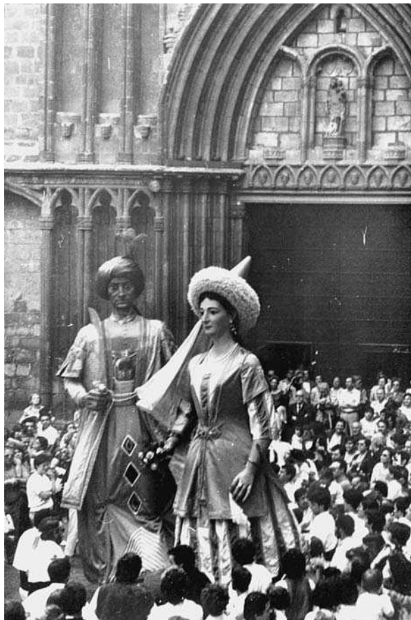
Gegants del Pi ballant davant Santa Maria del Pi de Barcelona (1981).