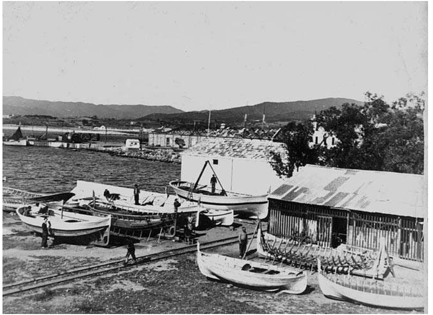
Vista d'una drassana, amb embarcacions en diverses fases de construcció.

Aquests oficis relacionats amb el fet marítim, bé sobre els bastiments o embarcacions, bé en terra, es mantingueren pràcticament immutables al llarg dels segles. En aquest sentit, hi ha un estudi de Maria Mercè Costa, publicat a Estudis del Baix Empordà , que parla de la reparació d'una nau al port de Palamós el 1434, durant el regnat d'Alfons el Magnànim. En aquest estudi, s'hi comptabilitzen les despeses, els materials i els honoraris pagats als operaris. I s'hi enumeren també tot un seguit d'oficis: mestres d'aixa, calafats, ferrers, boters, car-