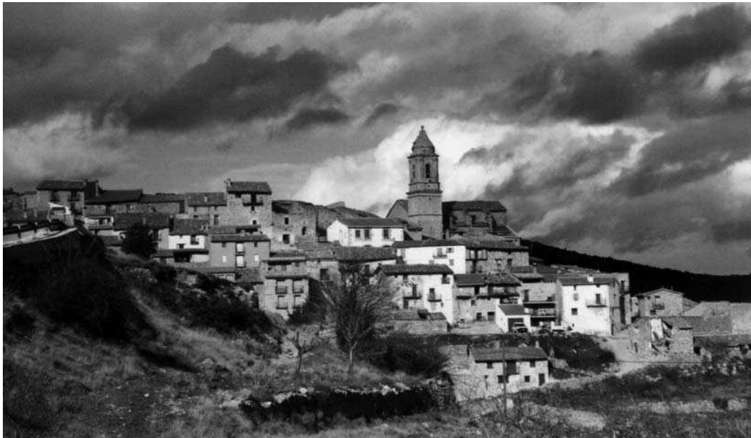
El Boixar (la Pobra de Benifassar, el Baix Maestrat) és un exemple de població pràcticament deshabitada que, no obstant, té 16 veïns empadronats (IVE, 2006).