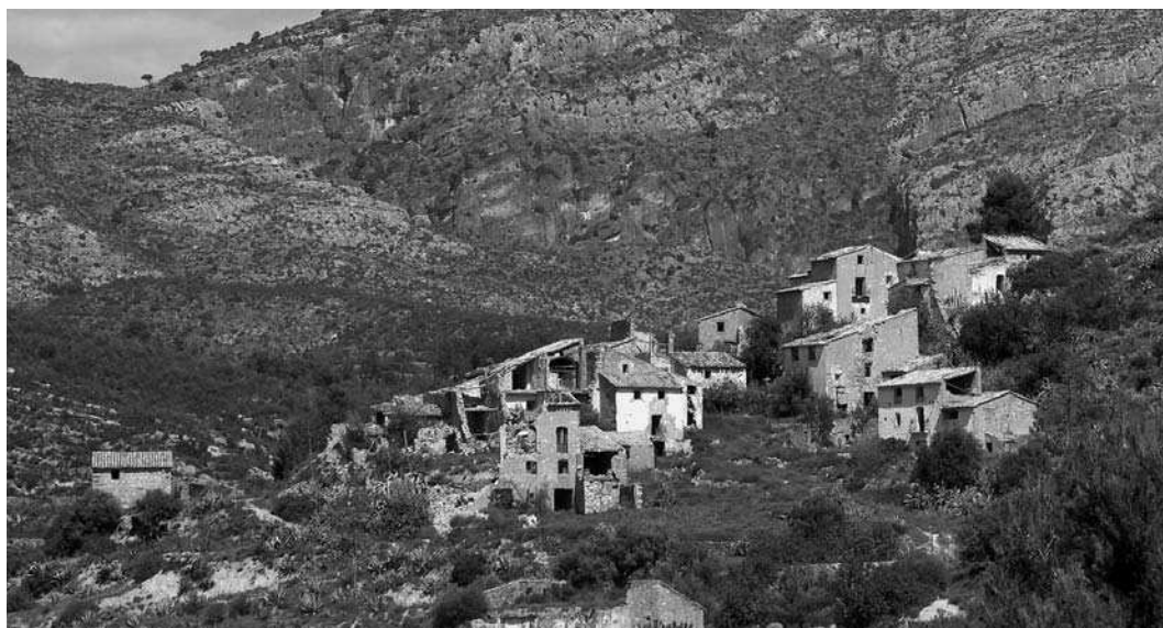
Vista del Mas del Rogle (l'Alcora, l'Alcalatén). Hi ha habitatges a una o dos aigües en el conjunt.