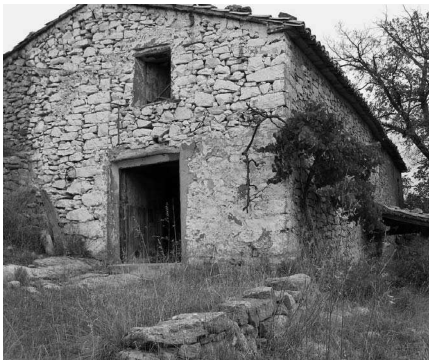
Masia de Vicenta (Ludiente), on es pot apreciar la tipologia constructiva en pedra, amb teulada a dos aigües, pintura blava en els marcs i elements accessoris.

Este conjunt de masies, aldees i nuclis de població, a més, es localitza en un paisatge rural que en unes dècades ha guanyat una notable quantitat de vegetació arbòria i arbustiva. En abandonar-se les explotacions agràries, sembla com si la natura colonitzara novament l'espai que un dia l'ésser humà li va furtrar. Ha sigut fonamentalment el pi qui ha substituït camps de conreu i ha menjat camins de muntanya, i encara continua avançant, conquerint fins a l'últim espai de la geografia rural de muntanya. Val a dir que este creixement planteja notables problemes de conservació de tots els conjunts construïts i, a més, és un material altament inflamable. Però aquest és un altre debat. Mentrestant, una part molt significativa de l'interior, i fins i tot del prelitoral valencià, continua perdent població i poblament, continua abandonant-se.