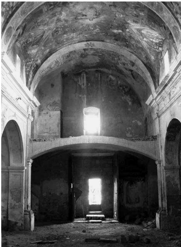
Interior de l'església de Benicalaf (Benavites, el Camp de Morvedre). Benicalaf va desaparèixer fa un segle i l'única resta és l'església. El seu terme s'agregà a Benavites.

alguns casos pràcticament s'ha esborrat l'accés (Mas de l'Hostal, Ludiente).