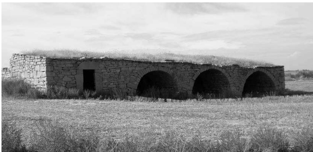
Pleta de Mont-roig, vista sud, amb les arcades que donaven a la tanca que avui no existeix. L'arcada de l'esquerra correspon a l'indret del pastor.

Josep Mora (Amics de l'Arquitectura Popular)