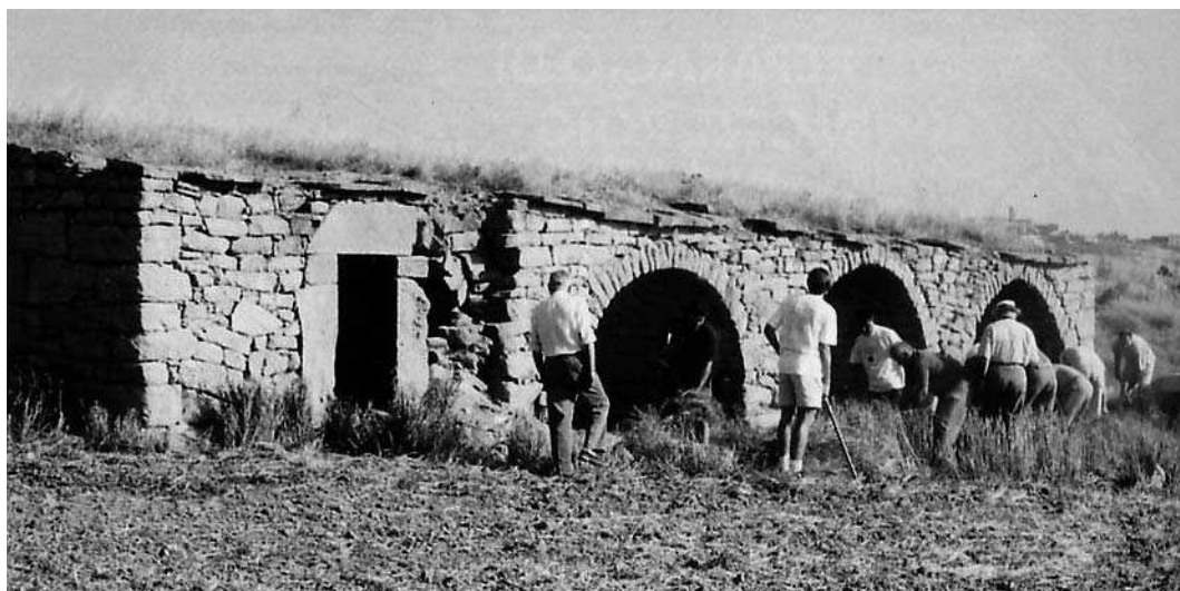
Intervenció en la pleta durant el curset d'estiu d'arquitectura popular de l'any 2001.