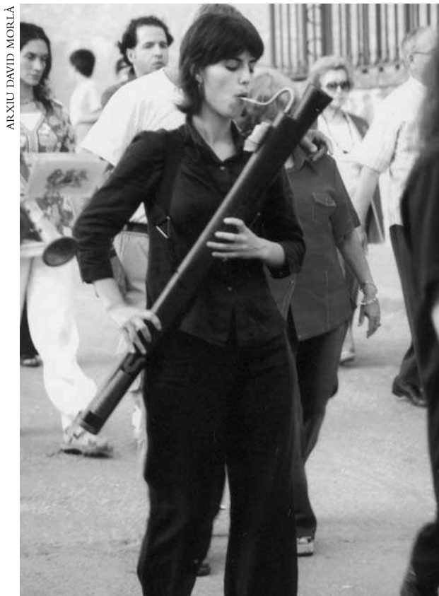
Baixonista actuant a la processó de Corpus de Torredembarra (Baix Gaià), juny 2007. L'instrument és fet d'una sola peça i en la part superior s'hi introdueix un tub metàl·lic en forma de S, el tudell, que serveix de suport de la canya.

Tant és així que a partir del segle XVIII s'utilitzen baixons antics o lleugerament reformats, baixons de nova producció (fets de tres peces) amb algunes incorporacions de les tècniques constructives del moment i fagots que podríem classificar de «baixonitzats», o sigui, adequats a la morfologia del baixó, amb una campana molt gran i oberta segurament