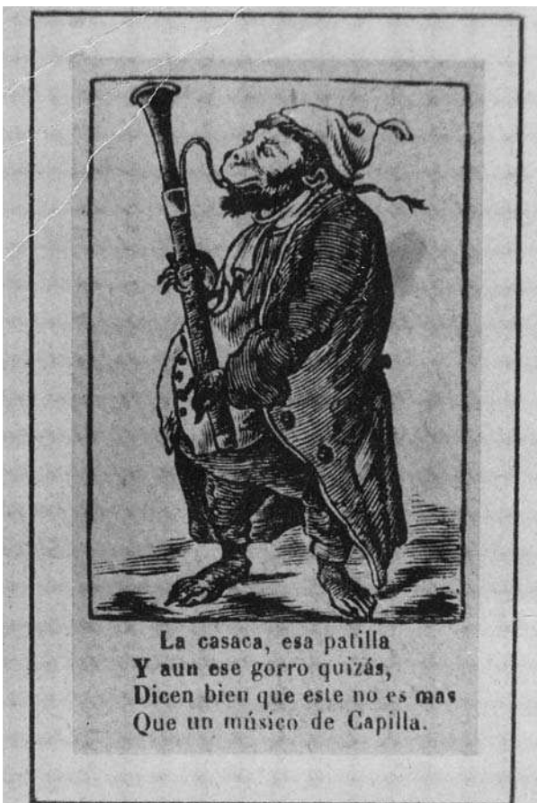
Vinyeta d'una auca de mones instrumentistes del segle XIX, ca. 1840. Observeu la tipologia de l'instrument, molt propera a la del baixó amb una campana molt oberta. Fins i tot pot voler simular estar fet de varies peces.