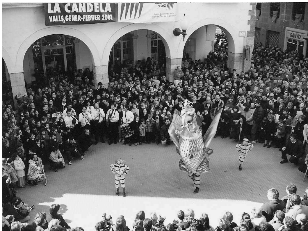
Els ministrers de Valls, amb una formació similar a la documentada el segle XVII, fent ballar l'àliga per les Festes Decennals de la Candela del 2001.

La música dels ministrers, tant la contractada per la vila com pels gremis i confraries, és present en tots els espais de la vida pública i