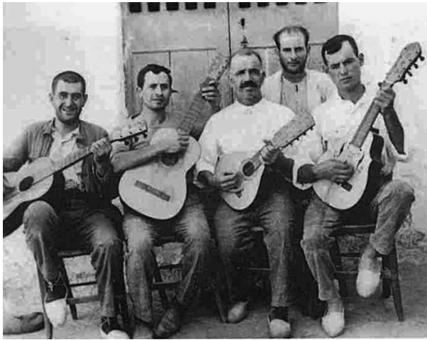
EXTREMIA DEL XVIII DELS MATEIRALS

Sonadors dels balls, fotografia feta a Migjorn per Baltasar Samper, Ramon Morey i Andreu Ferrer l'any 1927, de l'Obra del Cançoner Popular de Catalunya, on es veuen dues guitarres, una bandúrria i un llaüt.