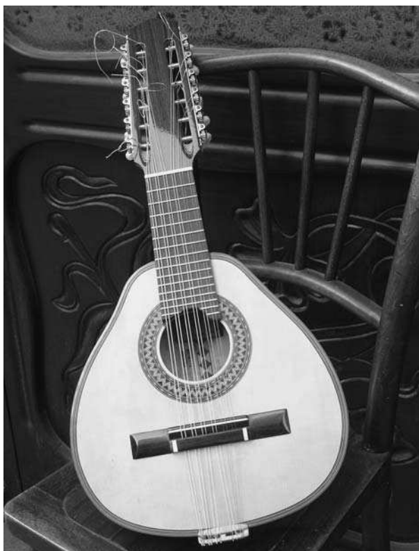
Bandúrria construïda per Raül Yagüe a Barcelona el 2007.

La bandúrria, si bé de tots coneguda, és un instrument del qual s'escriu més aviat poc en els cercles de la música de caire popular. La seua història, el fort arrelament que ha tingut en terres de parla catalana i la pràctica omnipresència en qualsevol tipus de manifestació de música festiva potser la fan mereixedora d'algunes línies.