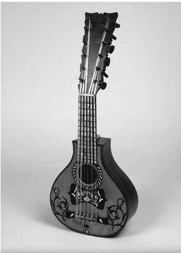
Bandúrria feta per Manuel Bertrán a Barcelona durant el primer terç del segle XIX.