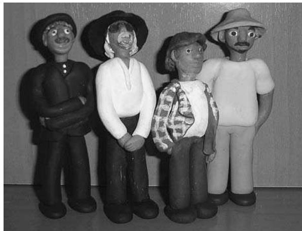
Reproduccions de ceràmica dels Quicos.

poc existien. No cal que t'ajudi ningú per a trobar-te cada setmana a cantar en un bar.