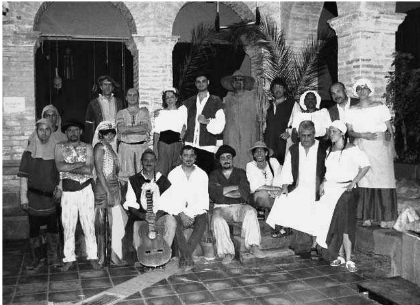
Foto de grup a La Taverna di Enrico.

Sí, clar. Els personatges estan creats a través de l'observació. Aquell tio pesat que no para mai de parlar, aquell que sempre ho sap tot... Quico i el Noi no estan fets a imatge d'una persona concreta però sí d'un tipus. Entre el Quico i el Noi hi ha la relació de pallaso llest i pallaso tonto, però en la que el tonto és tan llest com lo llest, i junts se complementen. Els nostres personatges estan a cavall entre la tradició i la modernitat, són uns equilibristes que pensen que no necessàriament tot lo d'ara és dolent ni tot lo d'abans era bo. Viuen al camp, rodejats d'oliveres, però som al 2008 i ara ja no tenen aquell fax que mereixia la visita dels convidats sinó correu electrònic.