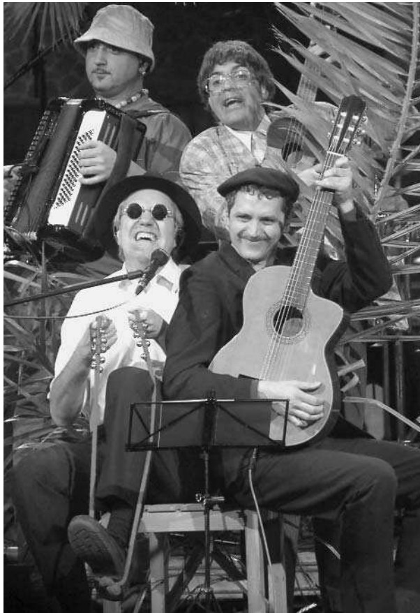
Foto del concert dels 10 anys al Palau de la Música Catalana (Barcelona).

Per la nostra experiència no, encara que hem de dir que és una experiència molt particular. I a més avui en dia la llunyania física és cada vegada menys important. Barcelona és imprescindible en moltíssimes coses i encara que estigues fora la tens sempre present. Los mitjans d'abast nacional, les discogràfiques en el nostre cas, tota una sèrie d'espais són allà. Però no és imprescindible viure-hi.