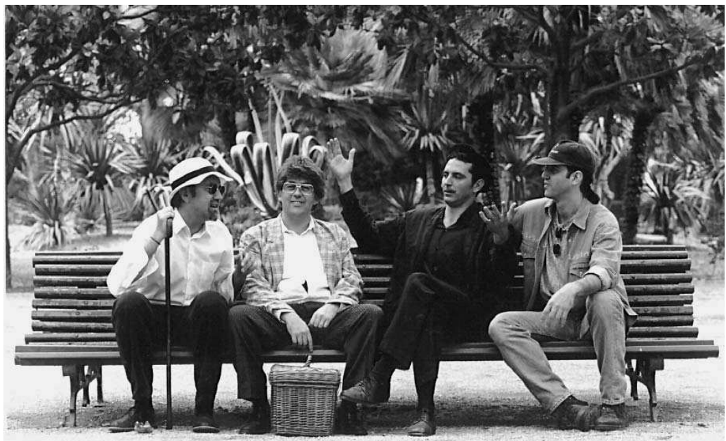
Banc del si no fos.