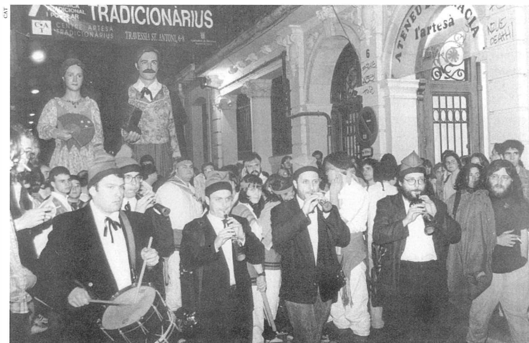
Seguici inaugural de la 7a. edició del Tradicionàrius. Grallers de Matadepera (Vallès Occidental)