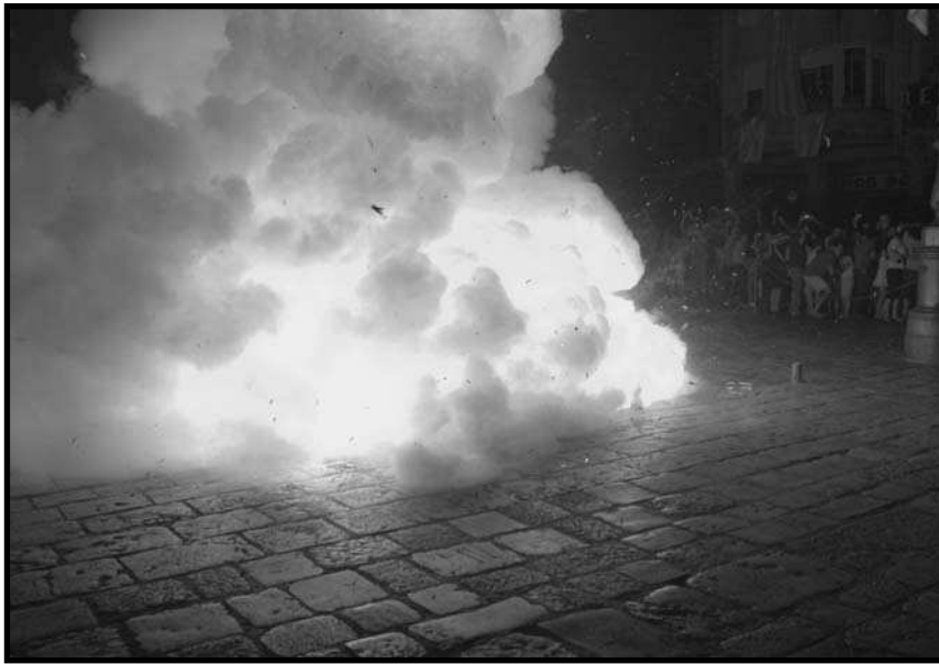
La Tronada, per la festa major de Sant Pere de Reus.

canterella femella. La traca amb canterelles mascles s'anomenà disparà o masclatà i corresponia a festes d'homes i sants, mentre que la de canterelles femelles seria la disparà femella , per a festes de dones i santes.