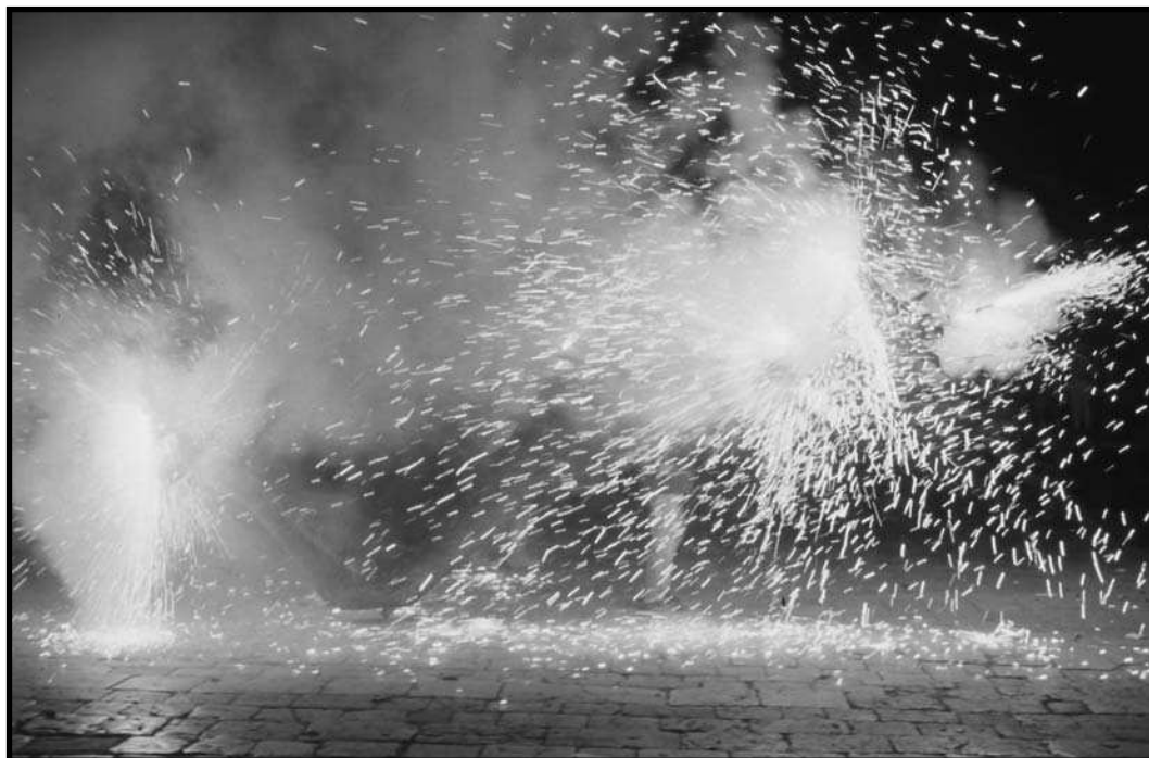
Drac de Tarragona.