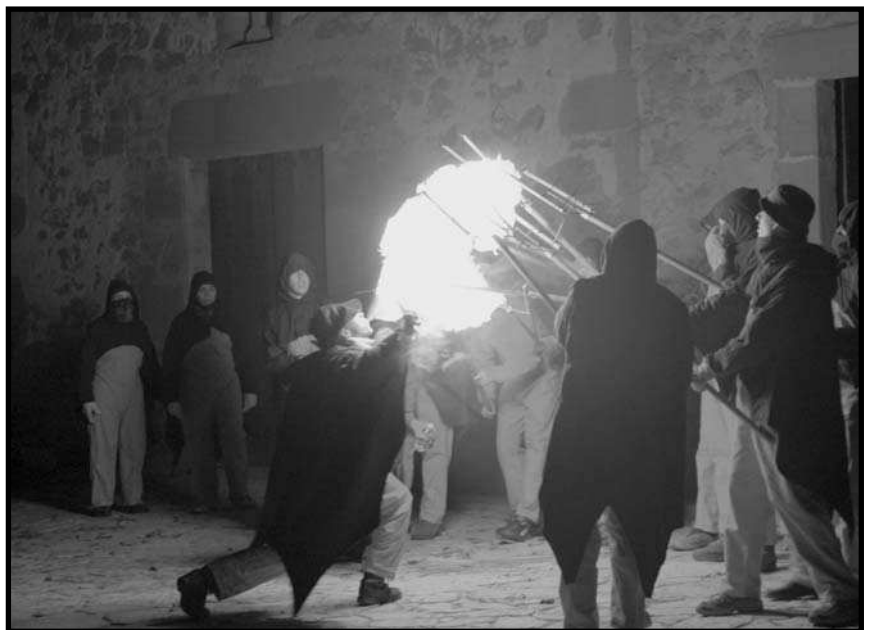
Els Cremats d'Olost, correfoc a Santa Creu de Joglars (Lluçanès).

Paral·lelament a la revolució valenciana basada en la participació, a partir dels trenta, els focs esdevingueren espectaculars quan els pirotècnics italians afegiren clorat potàssic —obtingut per Berthollet— a la fórmula preexistent, que posava molt més oxigen en la reacció química i la feia cremar més ràpidament i amb més temperatura. El 1845, la nissaga dels Ruggieri publica a França el primer tractat