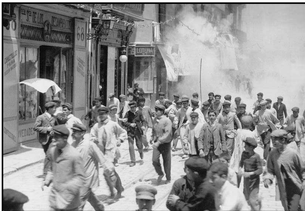
Disparà. València l'any 1905.

El 1445 apareix el mot coet al País Valencià. València estableix zones dins el casc urbà on es fabrica i ven pirotècnia, fins al punt que el 1469 es dicten prohibicions «per quant experiència ha mostrat que les cases en les quals pólvora, coets e tronadors se fan e se tenen, stan a gran perill de prendres foch en aquelles [...] maiorment quant en les dites cases promptíssimes a penre e encendres lo foch». Ateses aquestes raons «perquè incendi algú no si seguesca, stablexen e proveexen que [...] en algun temps no presomesca o gosa persona alguna fer pólvora, coets o tronadors o tenir o vendre aquells, sots pena de trents sóli-