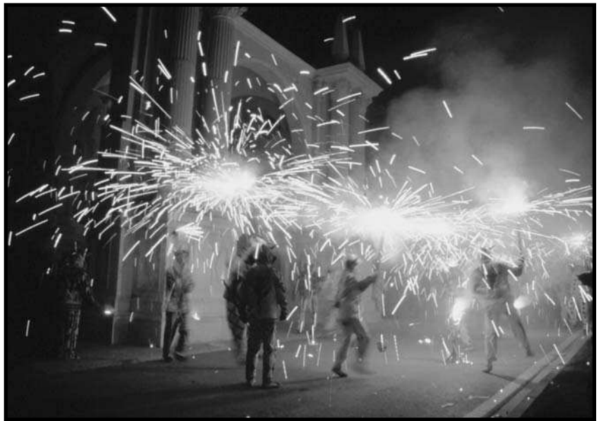
Actuació dels Diables de Reus.

canó de poc calibre i tret molt llarg, usada del XV al XVIII. És emprada al segle XV per Ausiàs March, per Joanot Martorell al Tirant lo Blanc , o en un document de 1463 de l'Arxiu General del Regne de València. És, doncs, un mot de la nostra llengua des de gairebé tres-cents anys abans de 1716. Rebia noms diferents segons la llargària: llegítimes , les de 30