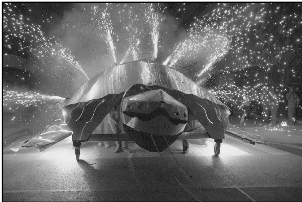
Tartaruga de Massalfassar.

pirotècnic amb fórmules per a composicions de colors.