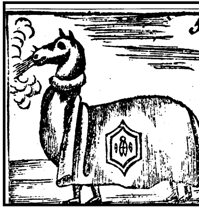
(esquerra) Gravats d'inicis del segle XVIII amb la mulassa portant un fuet a la boca. (dreta) La Víbria en una casella de l'auca del sol i la lluna, segle XIX.

La fabricació de pirotècnia a nivell local per a usos festius és generalitzada i arriba fins a mitjan segle XX. Paper d'estrassa, paper d'embalar, cordill i pólvora eren la matèria primera necessària, i si es tractava de coets, senzillament calia lligar-hi una canya. A Berga, fins a la dècada de 1970, els fuets, els preparaven els mateixos berguedans i aquesta fabricació casolana és la que dona peu a l'acte dels Quatre Fuets, que té lloc