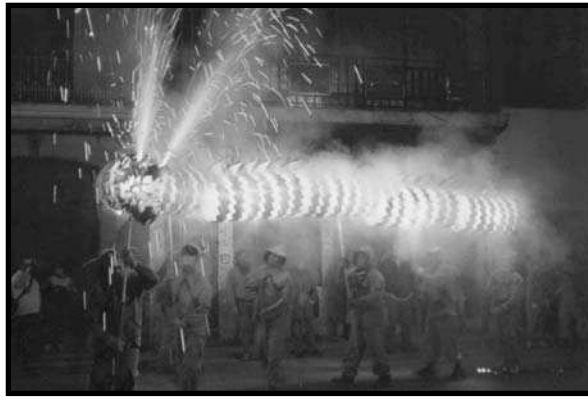
(a) Serp Na Miquela de Massalfassar (b) Drac d'Olot (c) Drac de Montblanc (d) Fardatxo Rasquera; (e) Drac de Reus; (f) Drac de l'Arboç (g) Marrantxa, rat penat d'Alaró

Al Principat actualment existeixen sobre els 1.200 elements de bestiari, la major part de foc, sense incloure el bestiari infantil i els ca-