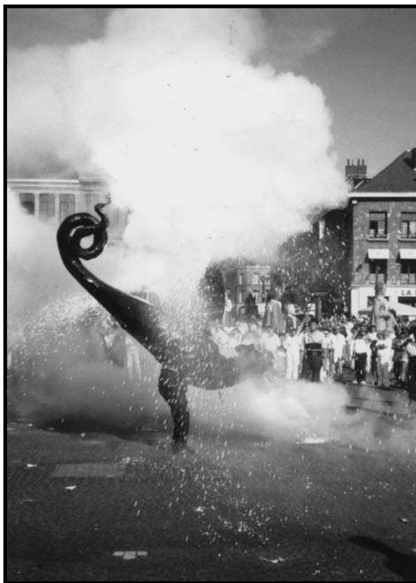
Drac de Vilafranca del Penedès amb la pirotècnia encesa. Ath (Bèlgica), 2000.