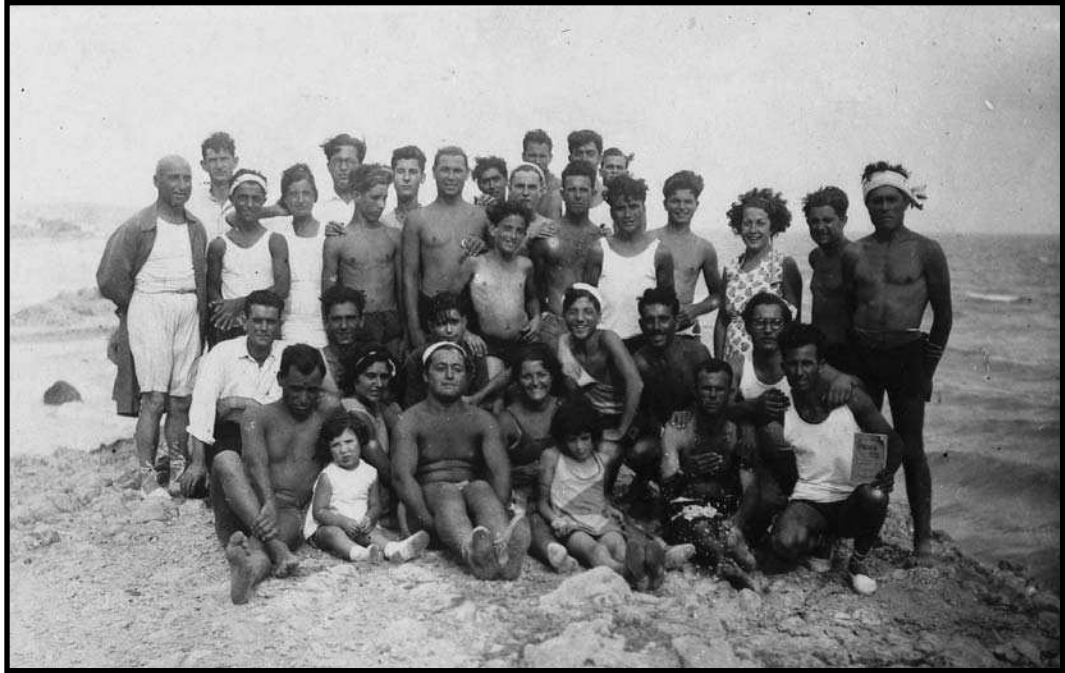
Membres del grup Sol i Vida al Maresme. Anys 1927-1932.

allà es feien cantades de cors claveïrians, paelles o sardinades, i naturalment un míting o xerrada. La composició dels assistents a aquests aplecs era molt semblant a la que els anarquistes havien posat de moda vint anys enrere, però ara la merienda aplegava centenars de «correligionaris», que és com s'anomenaven entre ells els membres del Partit Radical.