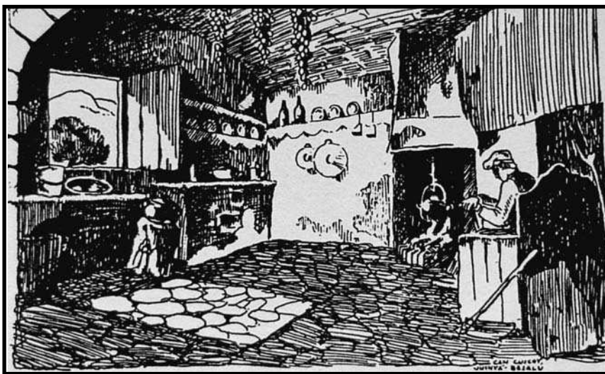
Dibuix a la ploma de M. Ricart: la cuina de can Coscoi (Junyà-Besalú).

institucions, entre d'altres, de l'ajuntament de Barcelona, la Generalitat de Catalunya i la mateixa Fundació Concepció Rabell i Cibilis-Estudi de la Masia. El primer concurs va ser convocat la tardor de 1930, s'hi van presentar 118 dibuixos i es va premiar exclusivament aquells dibuixos presentats per membres de l'entitat.