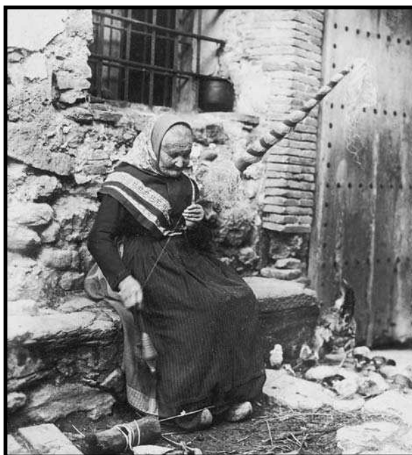
Per encàrrec de l'EMC, Amades va elaborar un estudi sobre el cultiu del lli i el cànem. A la imatge, una filadora de cànem (Ripoll, 1926).