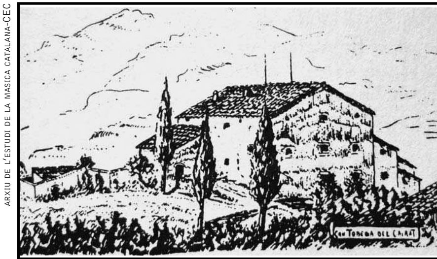
Dibuix a la ploma de J. Tobella: Can Tobella del Cairat, Esparreguera.

El treball sobre la indústria del lli i el cànem s'inscrivia dins de l'interès de l'EMC per l'estudi de la vida pagesa, i en concret, de les indústries casolanes. Amades rep l'encàrrec de dit estudi a data de 4 d'agost de 1932: