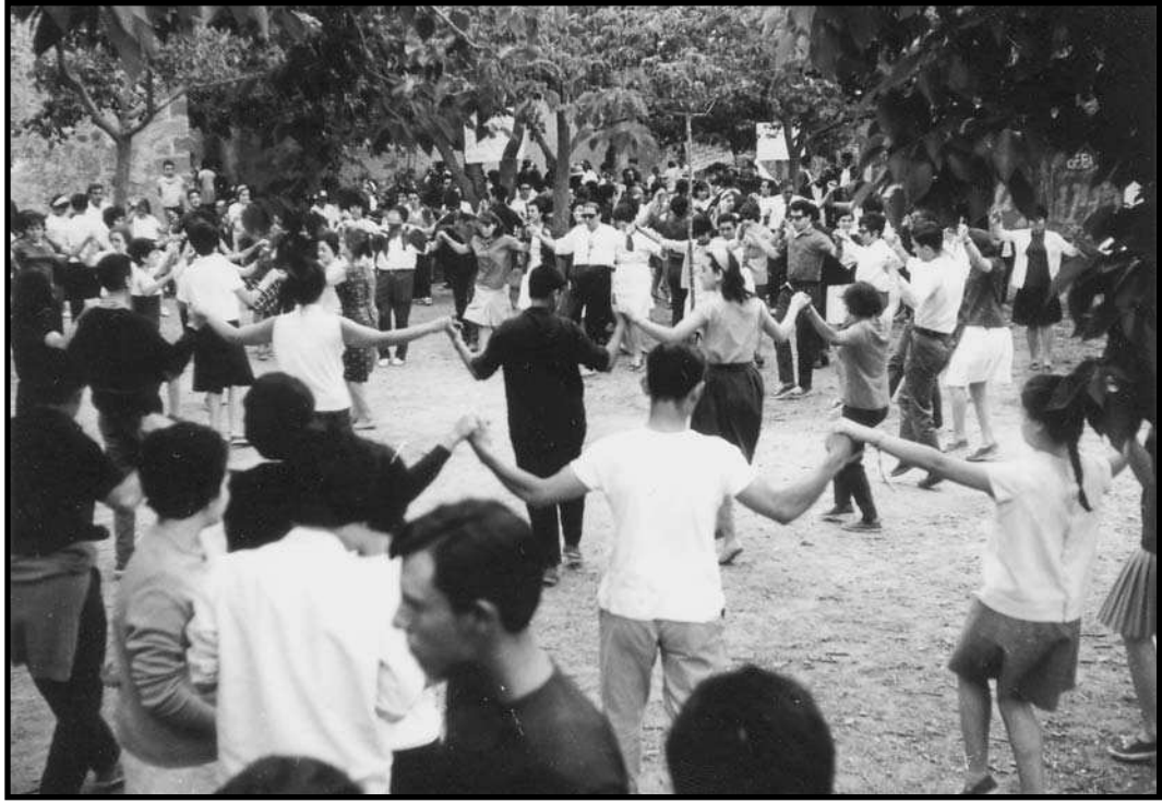
Ballant sardanes a l'aplec.

de Informació y Turismo, que mai havia vist amb bons ulls la realització d'aquests aplecs i que segurament va utilitzar el cas de l'aplec del 1964 per posar punt i final a uns aplecs que ja havien pres massa embranzida i un caire que les autoritats franquistes no estaven disposades a tolerar; i així s'acaben els aplecs o, com a mínim, la seva versió més nacional, ja que el 1965 es va convocar una nova edició de l'aplec per part del Grup Germanor, però el rerefons ja era tot un altre. També cal tenir en compte que sorgiren discrepàncies entre els membres del Grup Germanor –de caire polític, econòmic i altres– que apaivagaren la força que el grup tenia, i que n'hi havia alguns que apostaven per recuperar-los a Poblet i dotar, així, d'una imatge més catalana al monestir, per esborrar-ne la imatge més franquista que tenia, però la idea no va prosperar. Sí, però, que s'aconseguí celebrar uns aplecs –a imitació dels de la Selva però molt més modestos–, amb concurs literari inclòs, a Alforja, a càrrec d'un grup de joves d'aquella població. Quant als premis literaris, es convocaren, també, el 1965 i, de fet, es continuen convocant encara en l'actualitat.