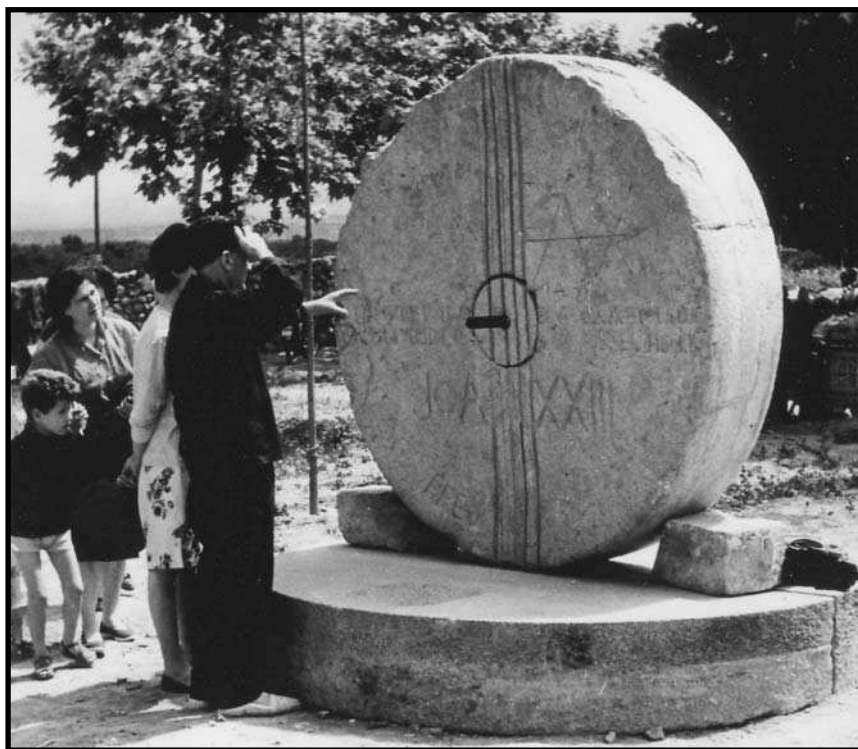
Monument a Joan XXIII, obra de Josep Grau-Garriga.

El 1963 l'aplec es va dur a terme el 19 de maig. En aquesta ocasió, Grau Garriga va col·laborar en el llibret, com ja feia normalment, però d'una manera especial: el llibret compta amb diferents xilografies dels seus dibuixos, uns dibuixos de caràcter més o menys religiós.