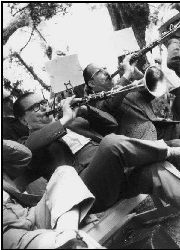
La Cobla Reus, habitual a l'aplec.