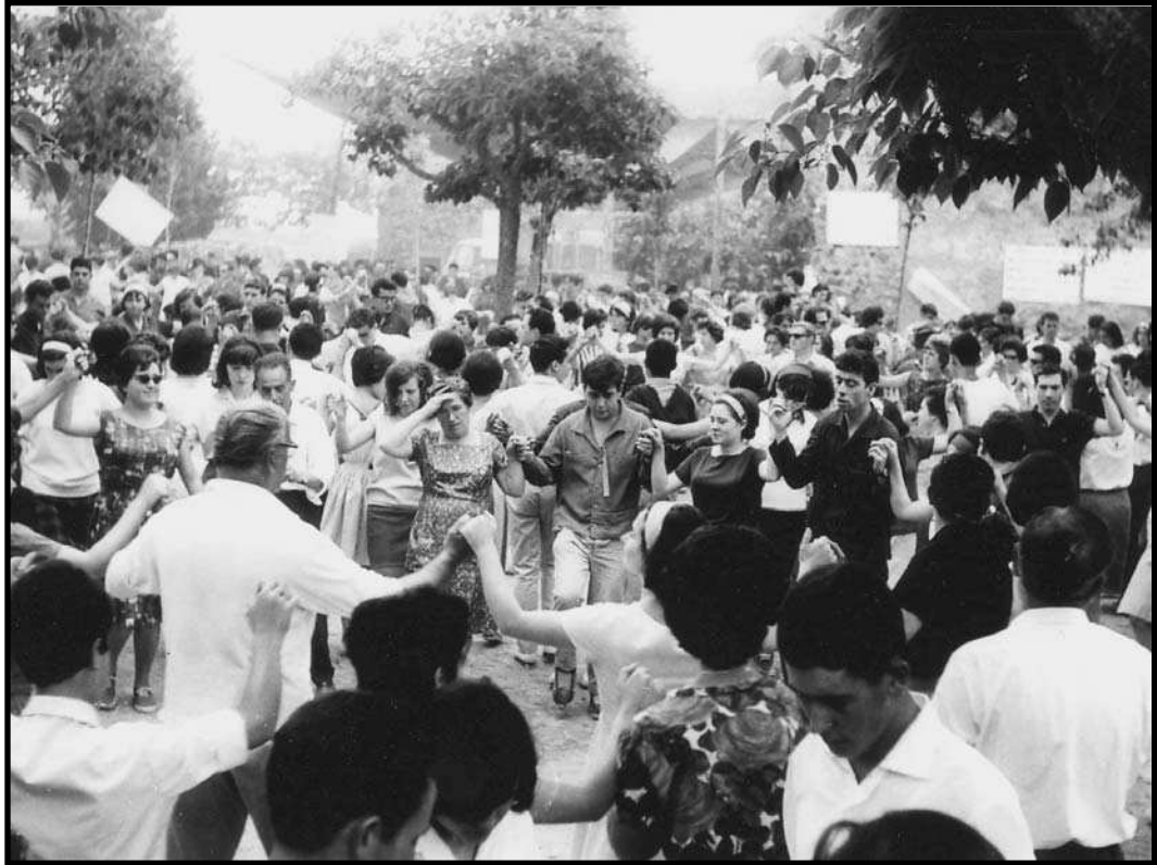
Ballant sardanes a l'aplec.

L'ofrena, en aquesta ocasió, vincula la jornada amb la religió, a partir del missatge que ja hem vist que es llança des del primer dels aplecs de responsabilitat de la mateixa gent en l'avenir del seu poble: