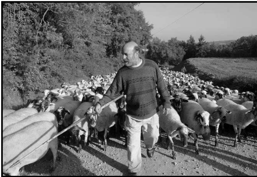
El Cuca controlant les ovelles amb el tirapeu.

Impulsor i dinamitzador dels gegants del seu poble, membre actiu del grup excursionista local, tres anys seguits el primer a acabar la Matagalls-Montserrat, membre de l'expedició del Bages que va fer el cim del Makalú, poques setmanes regidor del seu poble, viatger empedreït a la recerca dels racons més amagats del planeta on el primer i el darrer turista pot haver estat ell, membre de la junta d'una associació que es dedica a promoure la seva comarca a través de la música i la cultura popular, infatigable conversador... Aquesta podria ser la descripció genèrica de l'activitat d'algú que estima la terra, que la coneix i a qui li agrada la gent. I és així, però poques vegades pensàriem que amb aquest currículum estariem introduint-nos en la personalitat d'un pastor. D'un pastor en actiu, que s'hi ha dedicat tota la vida, que n'és descendent, de pastor, i que n'està orgullós, empenyat i satisfet.