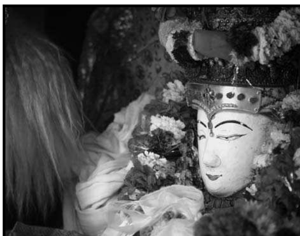
El Janabaha Dya, el Blanc Matxendra de Kathmandú, el març de 2007.