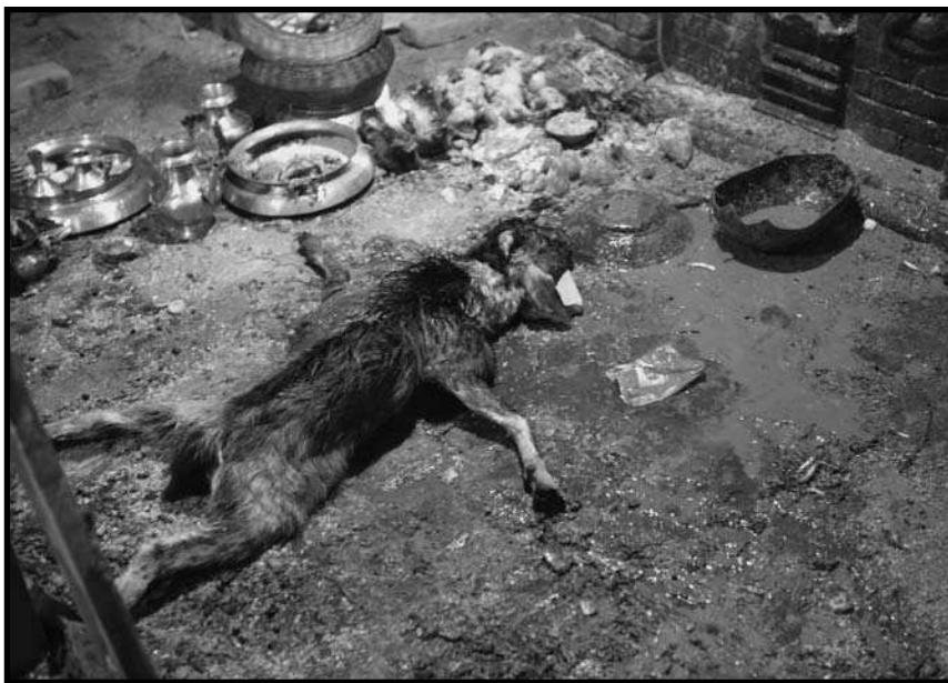
Sacrifici i ofrenes davant el temple de Bhairav a Bhaktapur (Nepal), durant el Bisket Jatra 2007.