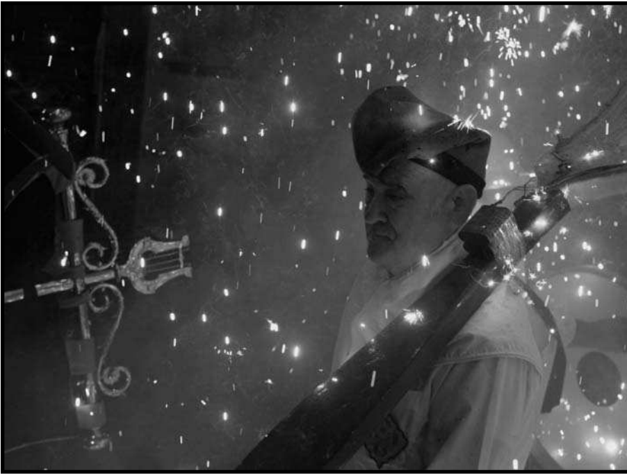
Festa de les societats corals del Raval, Barcelona el 2006.