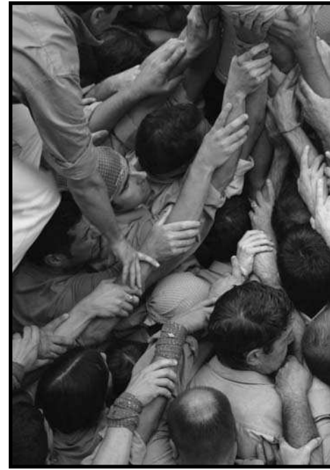
Castellers durant la diada de la Festa M.

digital de tots aquests materials i en la difusió de tot aquest coneixement a través dels nous mitjans de comunicació: bàsicament els ordinadors digitals i les xarxes distribuïdes i, concretament, d'internet.