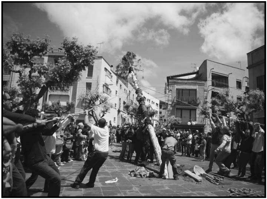
Festa del Pi a Sant Llorenç Savall (Vallès Occidental), el 2009.