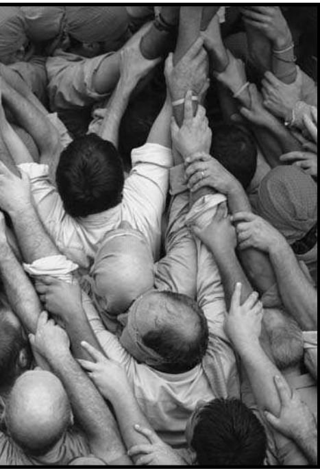
Major del Catllar (el Tarragonès), el 2008.