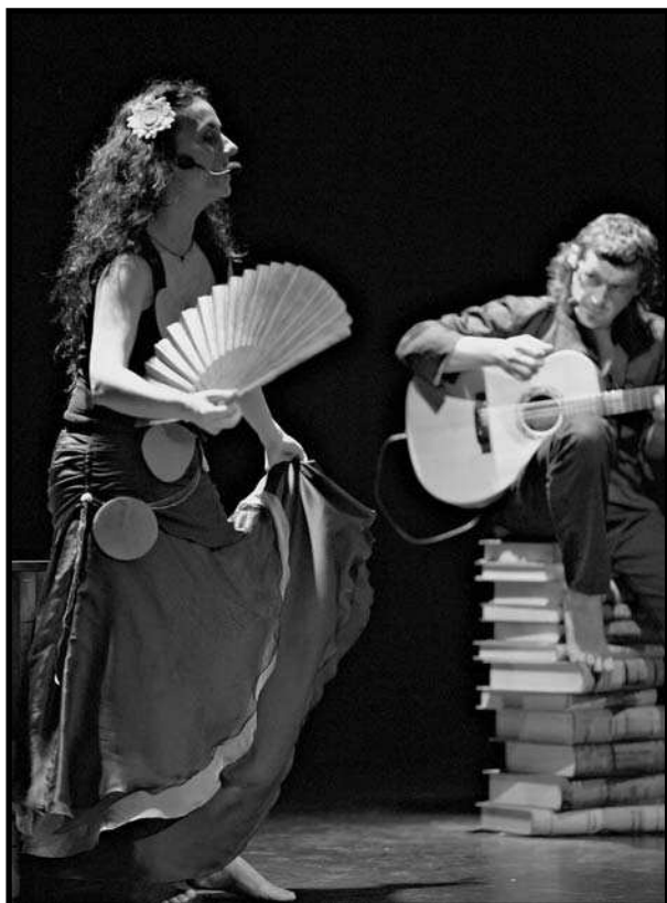
Samfaina de Colors en plena actuació.