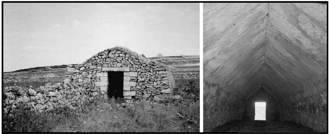
Exterior i interior d'un pont de bens.

va d'una llarga tradició ramadera, que els segles XIV, XV i XVI havia tingut moments d'esplendor. Hi ha testimonis documentals de què la llana de les ovelles menorquines era una de les més apreciades a Europa i el comerç de formatge d'ovella també era comú antigament. Encara avui, bens i ovelles són de raça autòctona menorquina de «rusticitat i prolificitat ben notable», segons