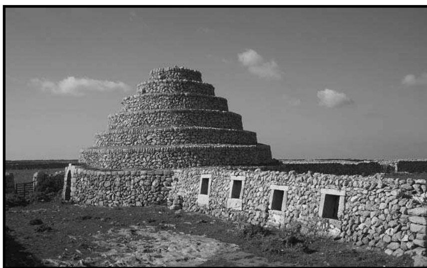
Barraca de Son Salomó.

Per als que aprecien les construccions en pedra seca, les grans barraques escalonades, de fins a set o vuit pisos, representen una peculiaritat extraordinària en aquests tipus de construcció, tant per la seva magnitud, com per la seva acurada tècnica. Però a Menorca, aquests tipus de grans barraques no deixen de ser excepcionals i fruit d'un moment històric relativament recent. La majoria i les més grans, (Ses Truqueries, Son Salomó, Ses Arenetes) son del segle XIX i, segons diuen, van ser promogudes per un propietari terratinent, el Comte de Torre-Saura, tant per aprofitar mà d'obra disponible en èpoques de penúria econòmica, com per la seva afeció a