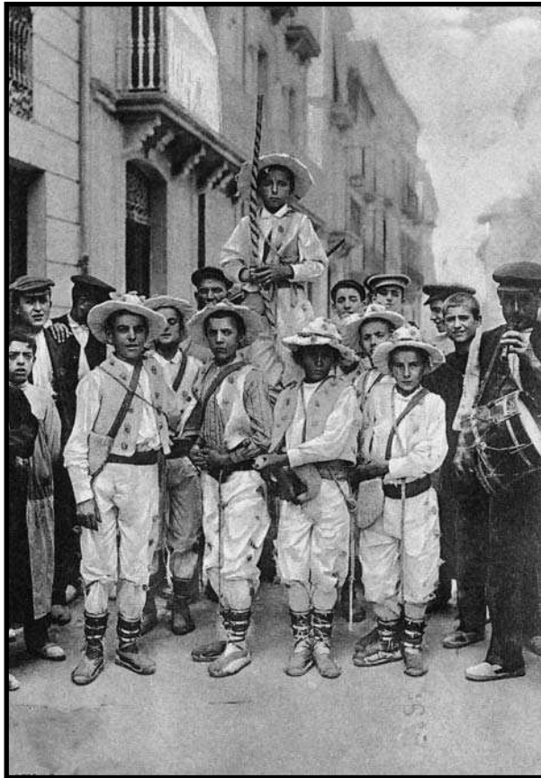
Ball de Pastorets de Vilafranca del Penedès.