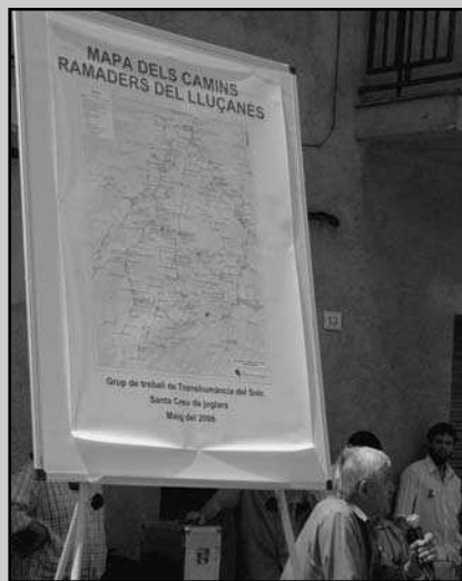
Presentació del mapa dels camins ramaders del Lluçanès (2008).

Avui disposa d'una pàgina web on es van recollint les diferents informacions de la seva tasca: www.solclluçanes.cat/trans