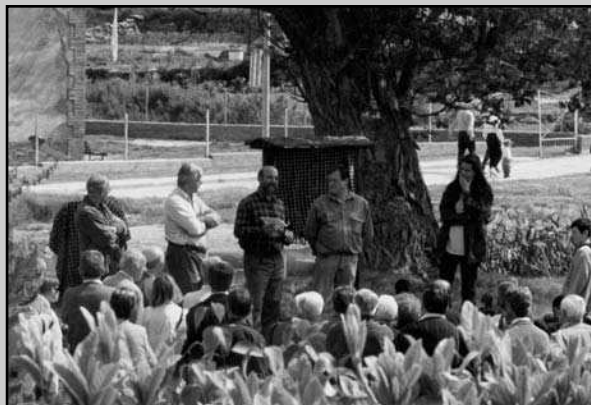
Inauguració del punt de trobada dels camins ramaders del Lluçanès (2000).