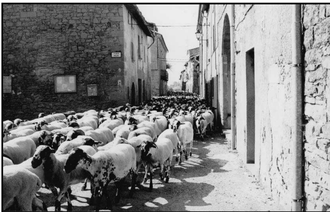
Ramat d'ovelles al seu pas per Santa Eulàlia de Puigoriol.

Les migracions suposen un dels més impressionants esdeveniments de la naturalesa que podem contemplar. Cada any milions d'animals —per terra, mar i aire— es desplacen d'un lloc a l'altre, forçats pels canvis estacionals del clima.