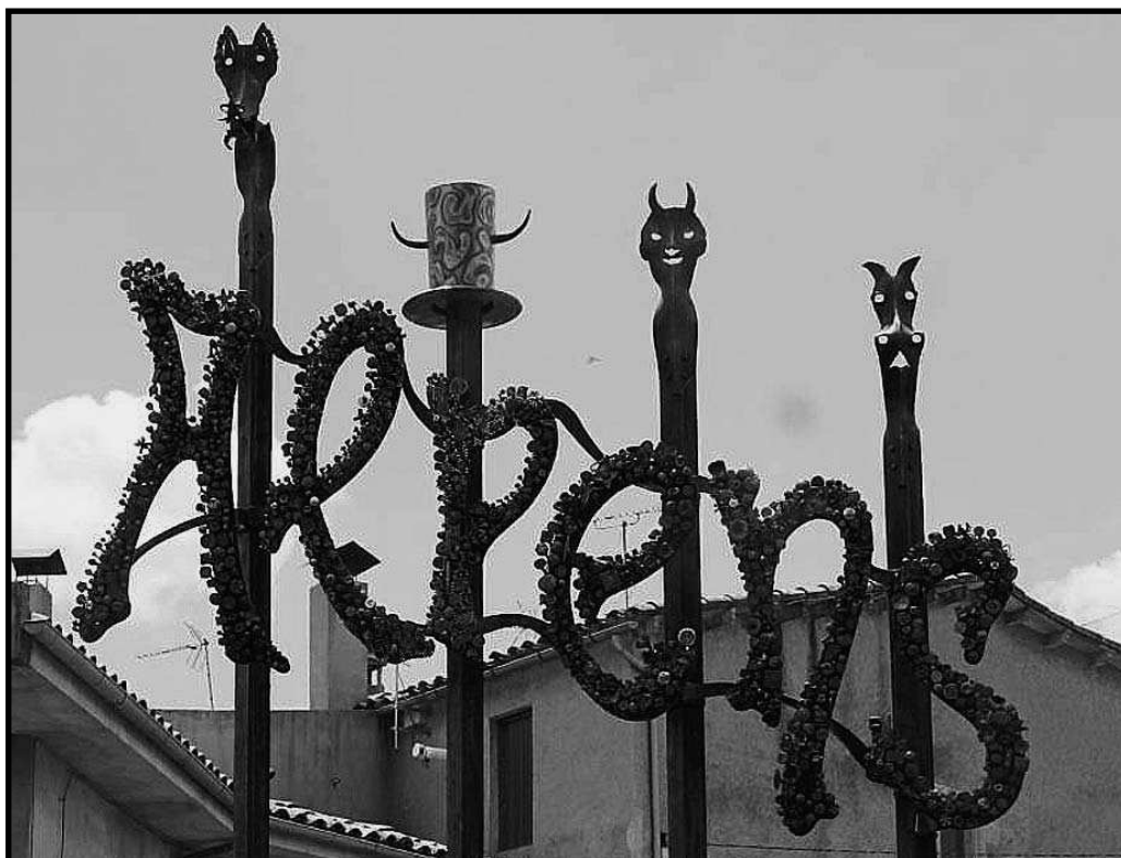
A Alpens, ferro i foc, forjant futur.