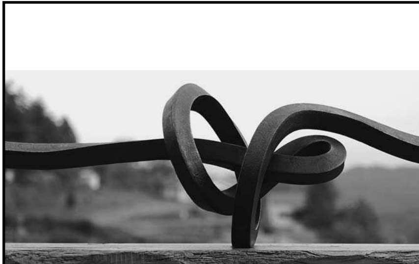
La sèrie de peces nusades, premiades i mostrades al jardí de casa de l'Enric.