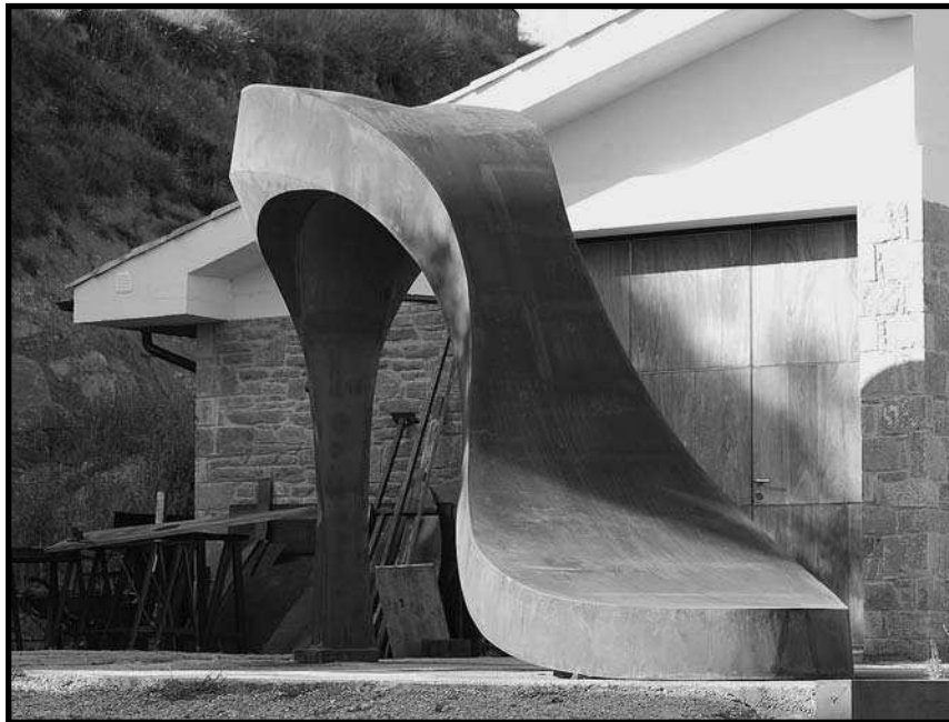
La gegantina sabata, inspirada en l'obra de Pedro Almodóvar, anomenada Feminitat II, està instal·lada a Granátula de Calatrava (Ciudad Real).