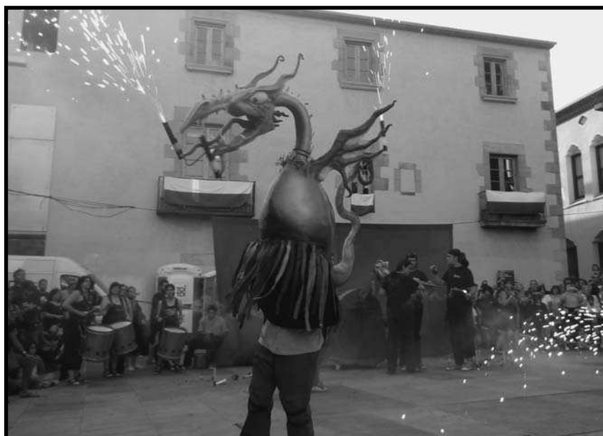
El drac petit de la colla infantil. La darrera incorporació a la imatgeria festiva de la colla.

els elements festius existents, però amb la condició que cada any pel correfoc en Banyetes sortiria i cremaria amb els diables.