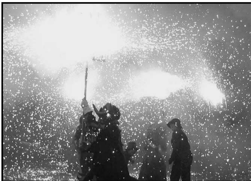
El Llucifer del Ball de Diables de Montornès del Vallès.

negre, caputxa amb banyes negres i espadenyes de beta; l'anagrama és idèntic al dels grans, però hi du un xumet a la boca.