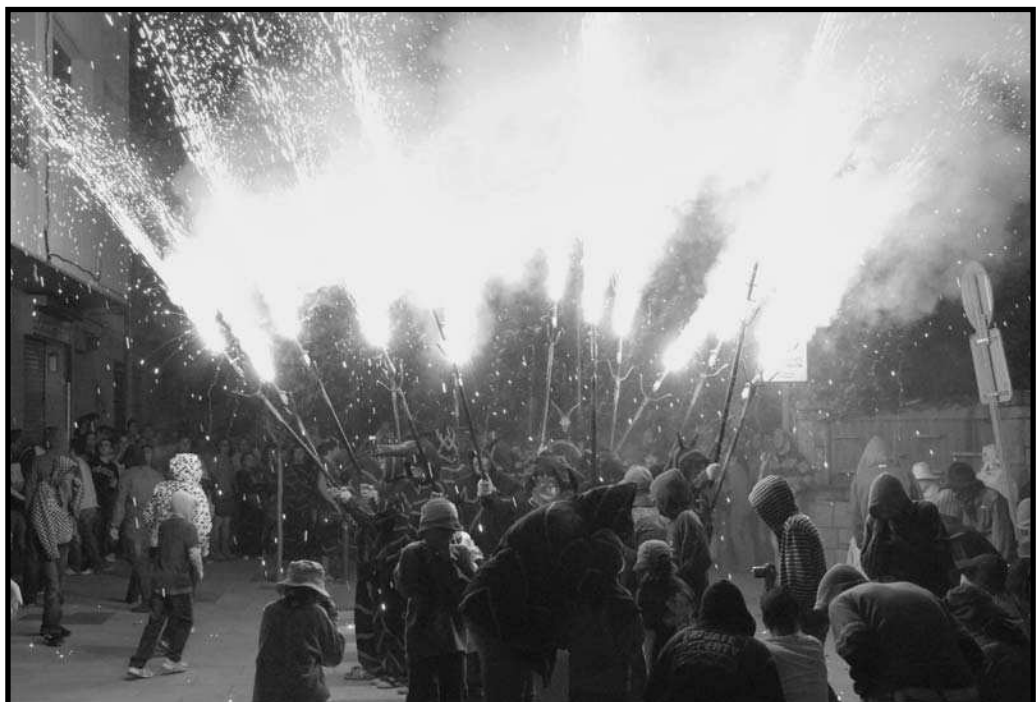
Encesa amb sortidors.

L'any 1994 és de ben segur molt important, no cau en cap celebració especial, però neix un nou element: el drac, obra de Ramon