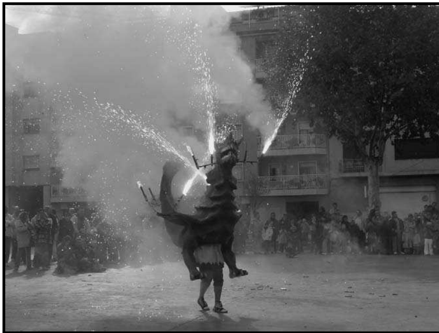
Actuació del drac Ceballot, creat el 1994.