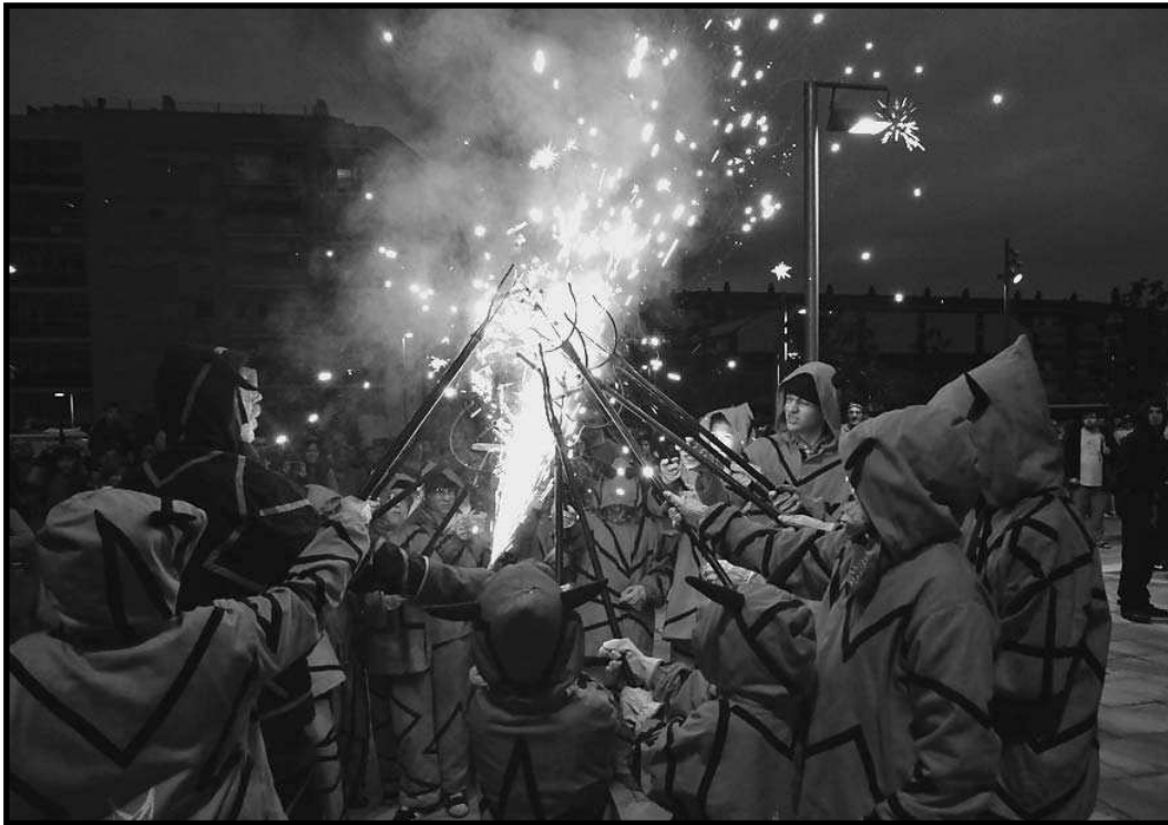
La colla infantil: treballant el futur.

Amb roba de sac poc atapeïda vàrem fer-nos el primer vestit: la jaqueta amb caputxa i unes banyes vermelles, i dúiem pintades unes flames –al·legoria al foc– al final de les mànigues, i a cada camal dels pantalons, la capa que ens protegia del foc, una faixa vermella amb la metxa penjant, un tros de pal amb una punta de ferro al capdamunt que feia de forca on portar les carretilles i la cara pintada de verd. Així vàrem sortir al carrer per Carnaval de l'any 1985 de Montornès del Vallès. De fet som una engruna del que havia estat feia uns anys abans la primera colla de dimonis, sorgida d'un taller que va fer en Xavier Bertran.