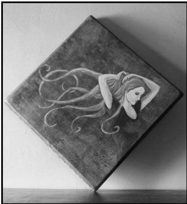
Pandero de Guillem Balatz pintat per l'Antònia Alcaj.

Concretament, parlo del pandero quadrat català. No sóc el primer a parlar-ne i de ben segur que no seré l'últim a fer-ho. Cal dir que n'hi ha a altres llocs del món i, fins i tot, cal admetre que en d'altres tradicions foranes s'ha mantingut més viu, però podem afirmar sense embuts que tenim la tradició dels panderos quadrats més grossos i lluïts de la galàxia!