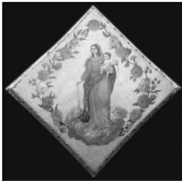
Pandero de Puigverd de Lleida, localitzat ara fa quasi deu anys sobre les voltes de l'església quan van fer obres.

La resposta aquesta pregunta és menys arriscada. Pels volts del segle XVI el pandero quadrat va quedar enquistat dins la paralitúrgia del procés de capta