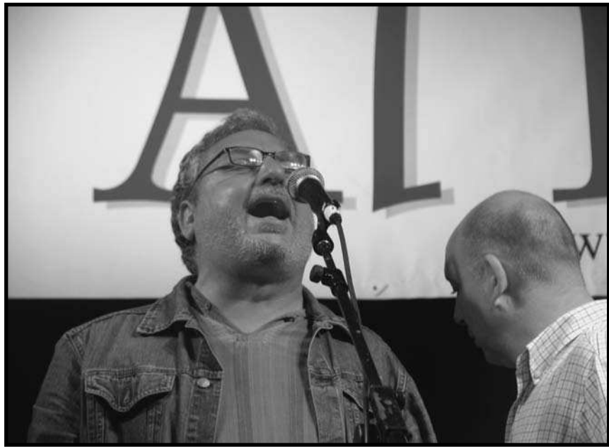
Apa al Cant al Ras de Massalfassar (2009).

Sí, és clar. Hi hem buscat altres coses. Segueix sent un disc amb molts aires del Mediterrani i jo