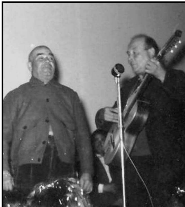
Masso, cantador de Benissanet, actuant al seu poble, a la dècada dels anys 1950.

com els de sis. N'és un exemple la següent jota de Francisco Llusíá Ardit Carrinya (1886-1971), d'Amposta: