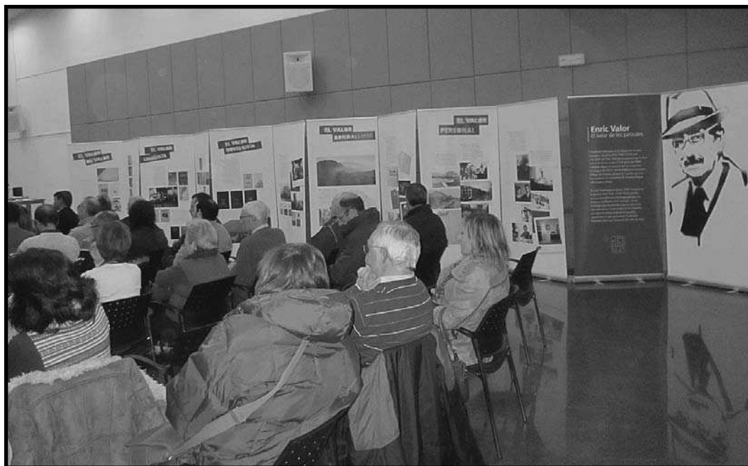
Exposició «Enric Valor. El valor de les paraules» a Cocentaina.

la llengua, des de la coneixença profunda de la nostra cultura i dels mecanismes creatius del valencià. A més, és l'escriptor que millor representa la continuïtat ininterrompuda de la tradició lingüística i literària valenciana.