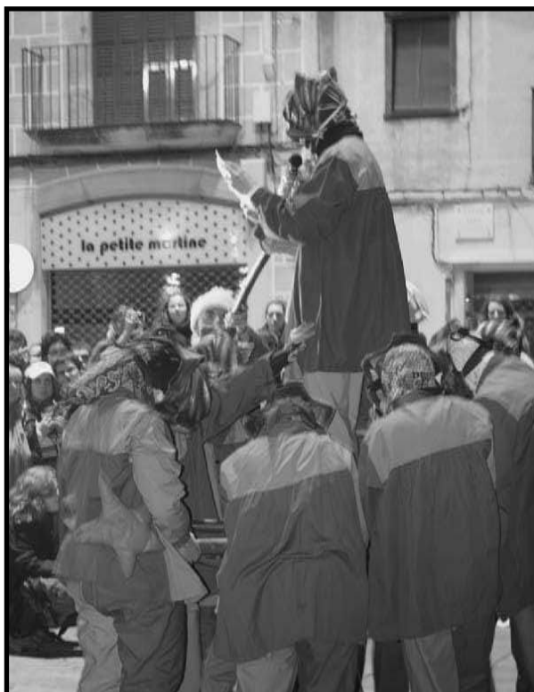
Lectura dels versots durant la Portabardellada.