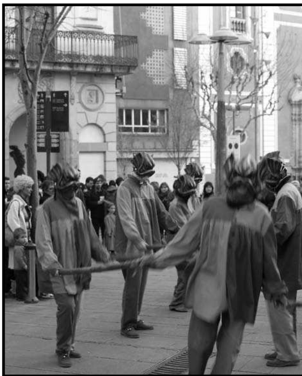
Ball dels Portafardells en l'acte de Derressaca.

Són homes i dones d'edats compreses entre els 18 i els 50 anys; hi ha estudiants, treballadors de