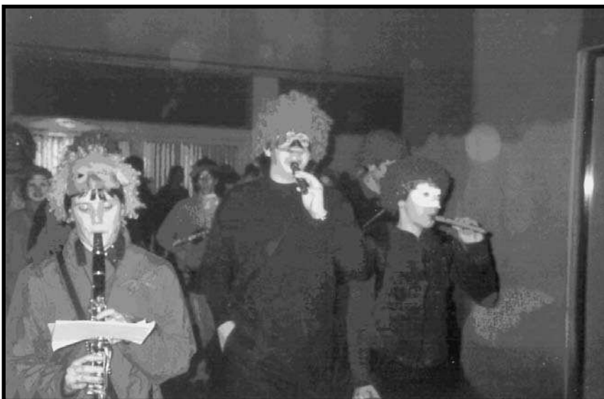
Comparsa de músics que acompanyen els Portafardells.