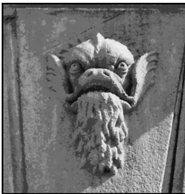
Figura del tritó que va inspirar les màscares dels Portafardells.