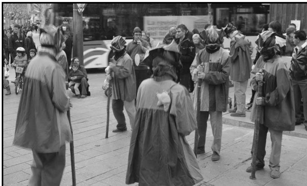
Ballant durant l'acte de Derressaca.

Durant els actes, però, el públic en cantussejava d'altres, que els músics tocaven d'oïda segons les demandes. Això s'ha continuat fent sempre.