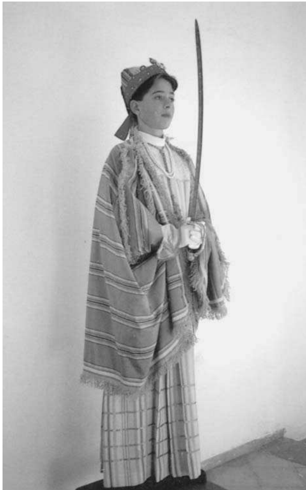
El blavet, abillat per cantar la sibil·la.