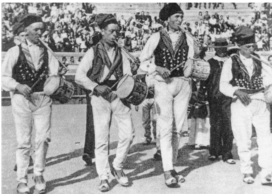
GRUP FOLK ORQUE D'IS CUBRELS, BALL PÀSIS, 1966