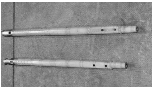
J. V. RECHINA

El tambor pagès està fet buidant un rabassó de pi, deixant només una riscla d'uns 5 mm de gruix. La riscla va estucada i pintada amb motius vegetals i geomètrics. Rares voltes es veu la fusta de la riscla, i mai es deixa