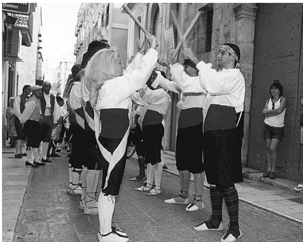
Dansant en la processó del Corpus d'Alacant (juny 2001)