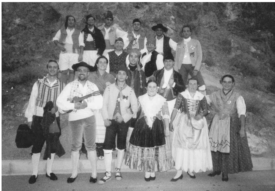
El Grup Alacant abans d'actuar (juliol 2001).

A tots els membres i col·laboradors del Grup perquè amb la seua amistat han forjat un projecte d'il·lusions.