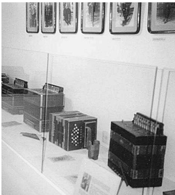
Una de les sales del Museu de l'Acordiò d'Arséguel (l'Alt Urgell).

VERD E BLU, Musica de Gasconha , Menestrèrs Gascons, MG 008