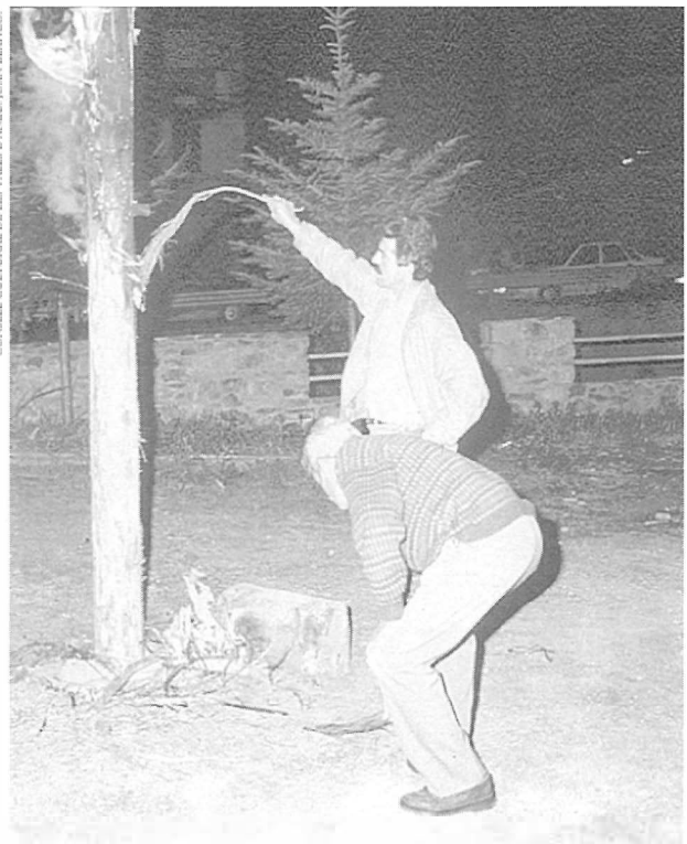
Iniciant el foc.

Si observem amb detall la festa, hi trobarem interessants contrastos que estan convivint en un mateix espai. Músiques diverses, balls tradicionals al costat dels últims ritmes i cançons de moda, foc i ball, símbols del present, etc. Tot plegat, una mostra que la nit de les falles és viva per ella mateixa, no com un fòssil supervivent que cal estudiar des de perspectives evolucionistes.