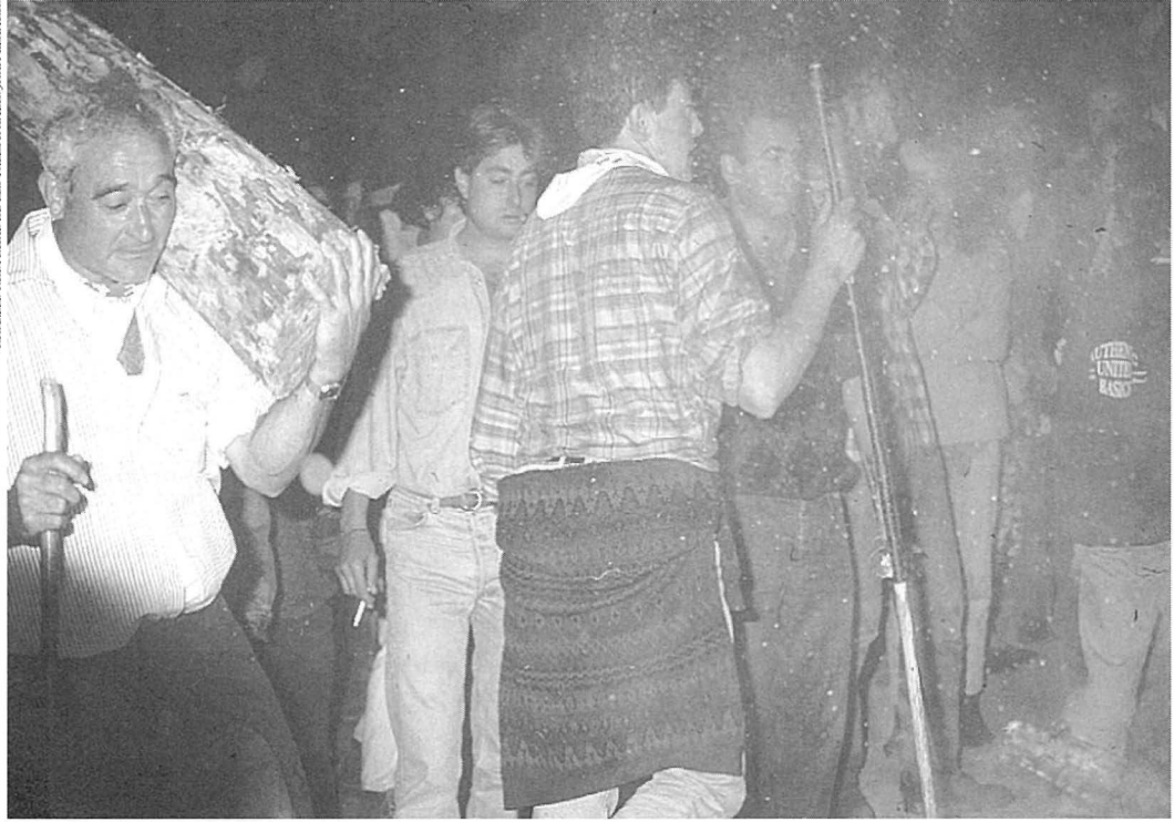
Les Falles són un ritual que sovint s'ha relacionat amb la masculinitat.