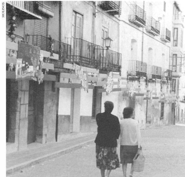
Ornaments al carrer de les Calçades (1988).

Arribats en aquest punt, cal dir que de cada dia de festa s'encarrega un gremi, que recapta els diners dels seus socis o afiliats. És una forma, actualment anacrònica, de possibilitar la participació de tots en les festes. Cada gremi o estament s'ocupa d'organitzar la missa major, cantada i amb sermó solemne, el retaule, les diversions populars i la revetla de la nit.