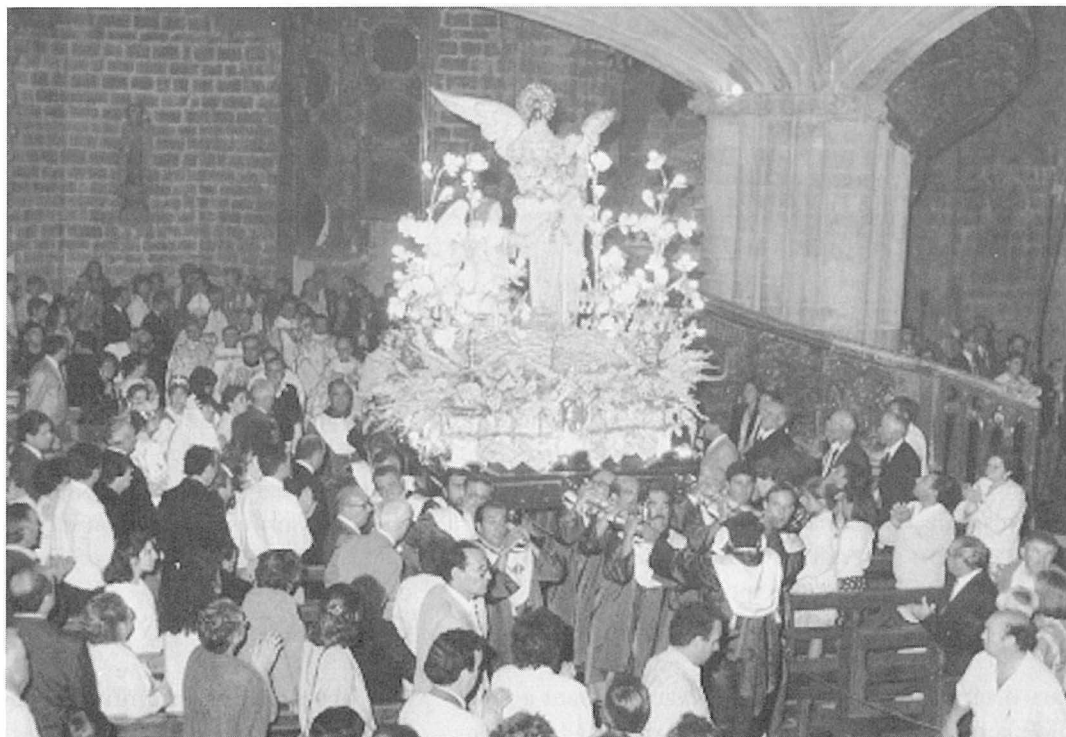
Imatge de la processó dins l'església.

A l'hora convinguda, i amb plena i total expectació, entra pel portal del Pla d'Estudi la bandera de Sant Antoni i, a continuació, tots els romers cantant la salve del rosari. En el moment en què la marededéu entra pel portal s'encén una traca perquè tots ho sàpiguen i tots els guions, banderes i peanyes facen les tres cortesies a la marededéu al temps que les danses fan el primer ballet, comença a tocar la música i totes les campanes del poble es posen al vol. Acte seguit es posa la imatge a la peanya i romp la processó que ha vingut a esperar la rogativa pels carrers, guarnits des de la nit anterior amb