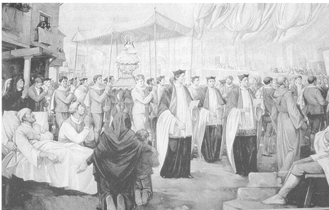
Quadre que representa la processó de pujada de la Mare de Déu l'any 1672.

El Sexenni, o les festes sexennals o simplement les Festes, com diem normalment els morellans, són una sèrie d'actes o celebracions solemnes que la ciutat de Morella (Els Ports) dedica a la Mare de Déu de Vallivana en un novenari d'agraïment per la desaparició de la pesta que en 1672 assolava la població.