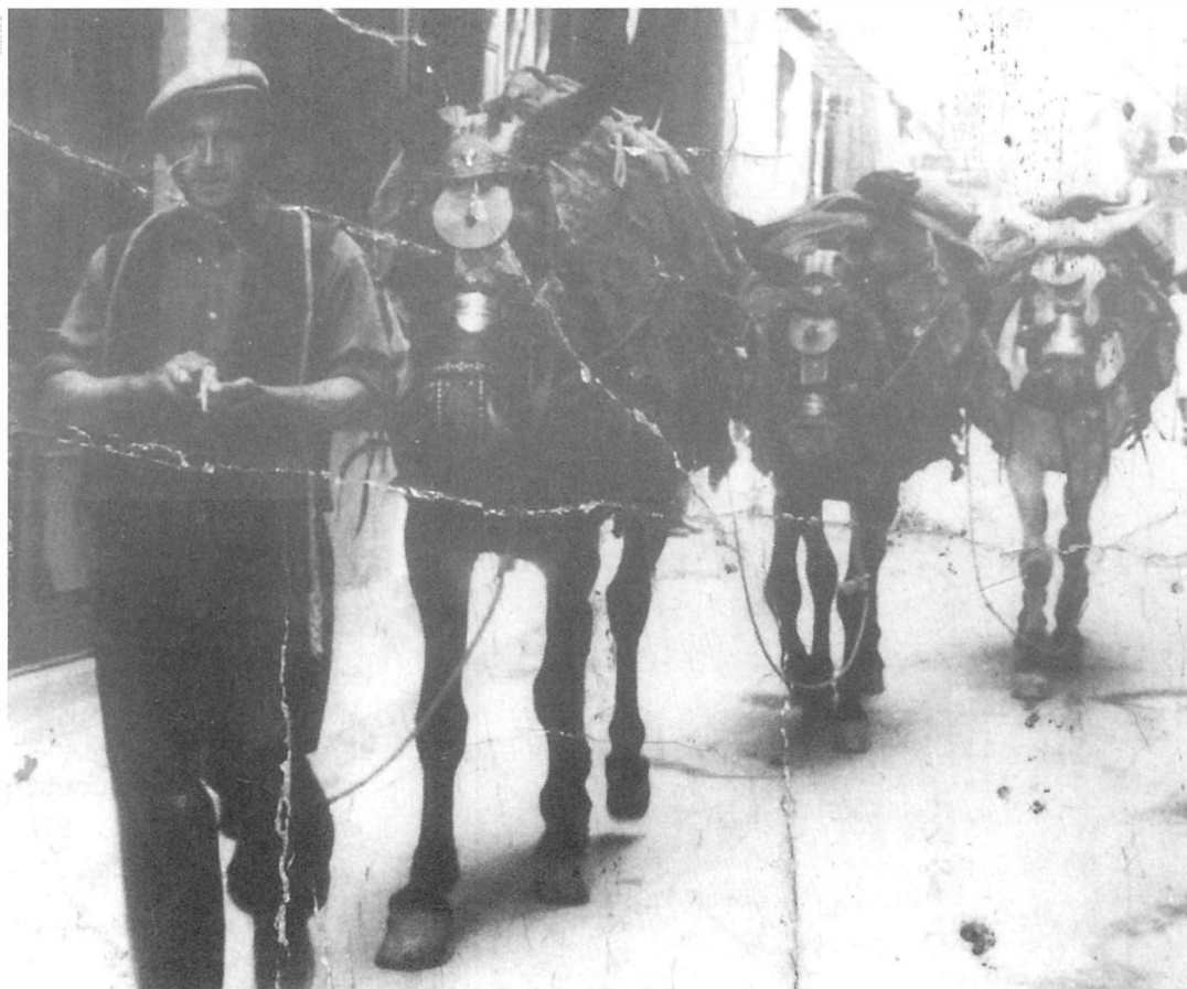
«Liant el cigarro» pel carrer València, de Camprodon, en un dia de pocs violins.