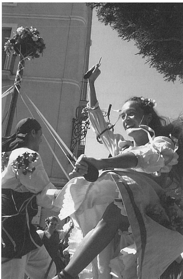
Els galerons no duen cinta i ballen al voltant del grup.