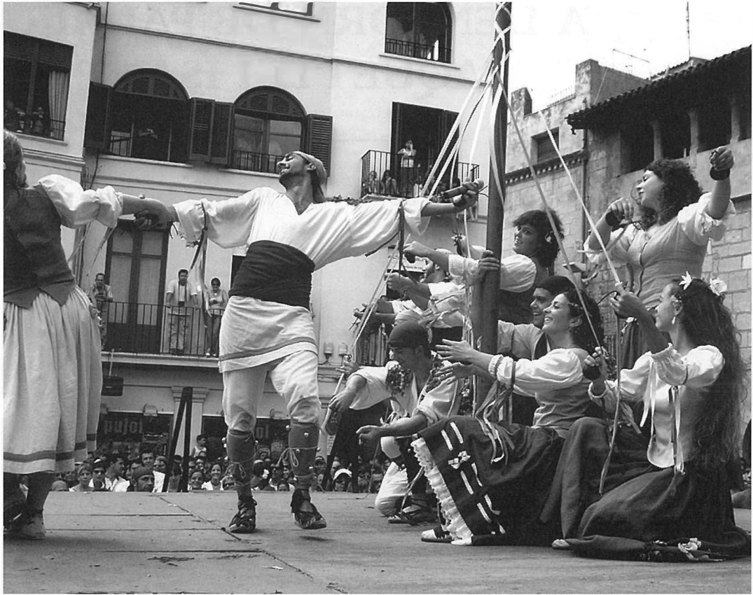
Representació del Ball Parlat.