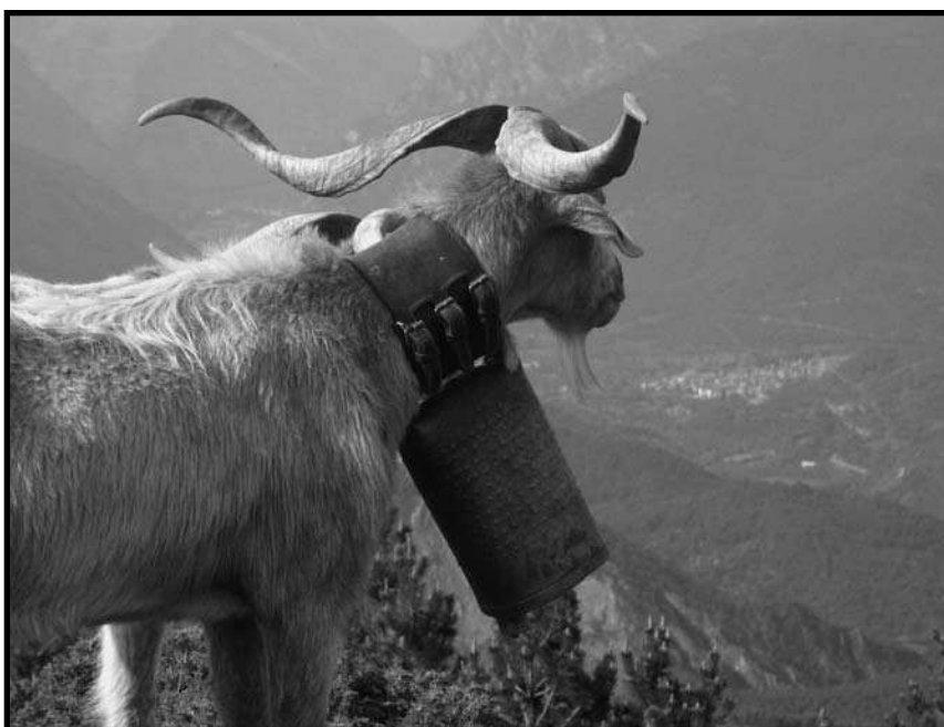
Un crestó de la ramada de Lloveto de Cardet mirant cap a Vilaller (Alta Ribagorça) des de la Serra de Sis (juny 2007).